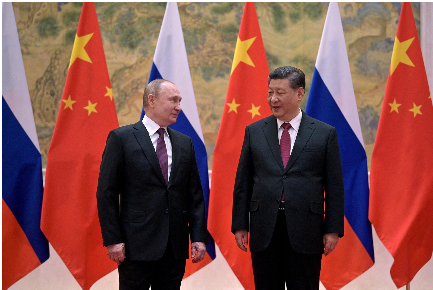
2022年2月4日，北京，俄罗斯总统普京与中国国家主席习近平会晤。

在观察这些评论人士使用的信息来源后，这种误判的根本源头便不难理解。不论是刻意传播俄罗斯的单一声音，还是习惯相信“友军”的情报，对于所谓“对面”的信息视而不见，结果都是预测与判断的错误。在这一点上，中国的领导人与微博上的“国师”表现出了高度一致。