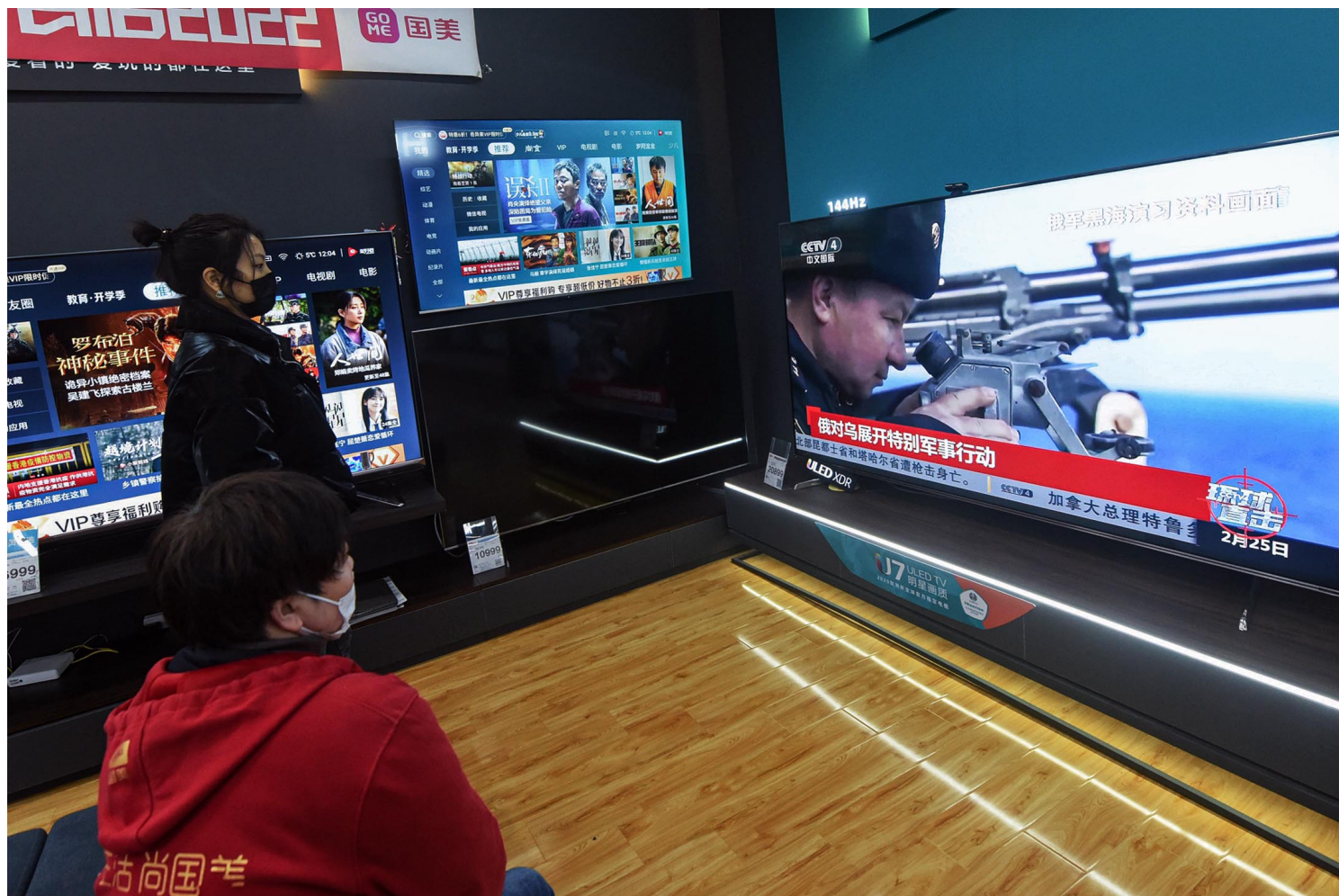
2022年2月25日中国杭州，一名公民在中国浙江省杭州市的一家商店内观看有关俄罗斯和乌克兰冲突的新闻。

国流行的“收留与兄三美女”等调侃鼓吹战争网络迷因有关。根据中文网络上流传的截图还称，一些滞留在乌克兰的留学生被持枪基辅市民盘问，并在谎称自己不是中国人后逃过一劫。这些网络迷因与民众支持俄罗斯入侵的行动被其他国家的网民看到，据说激起了乌克兰民众的愤怒。