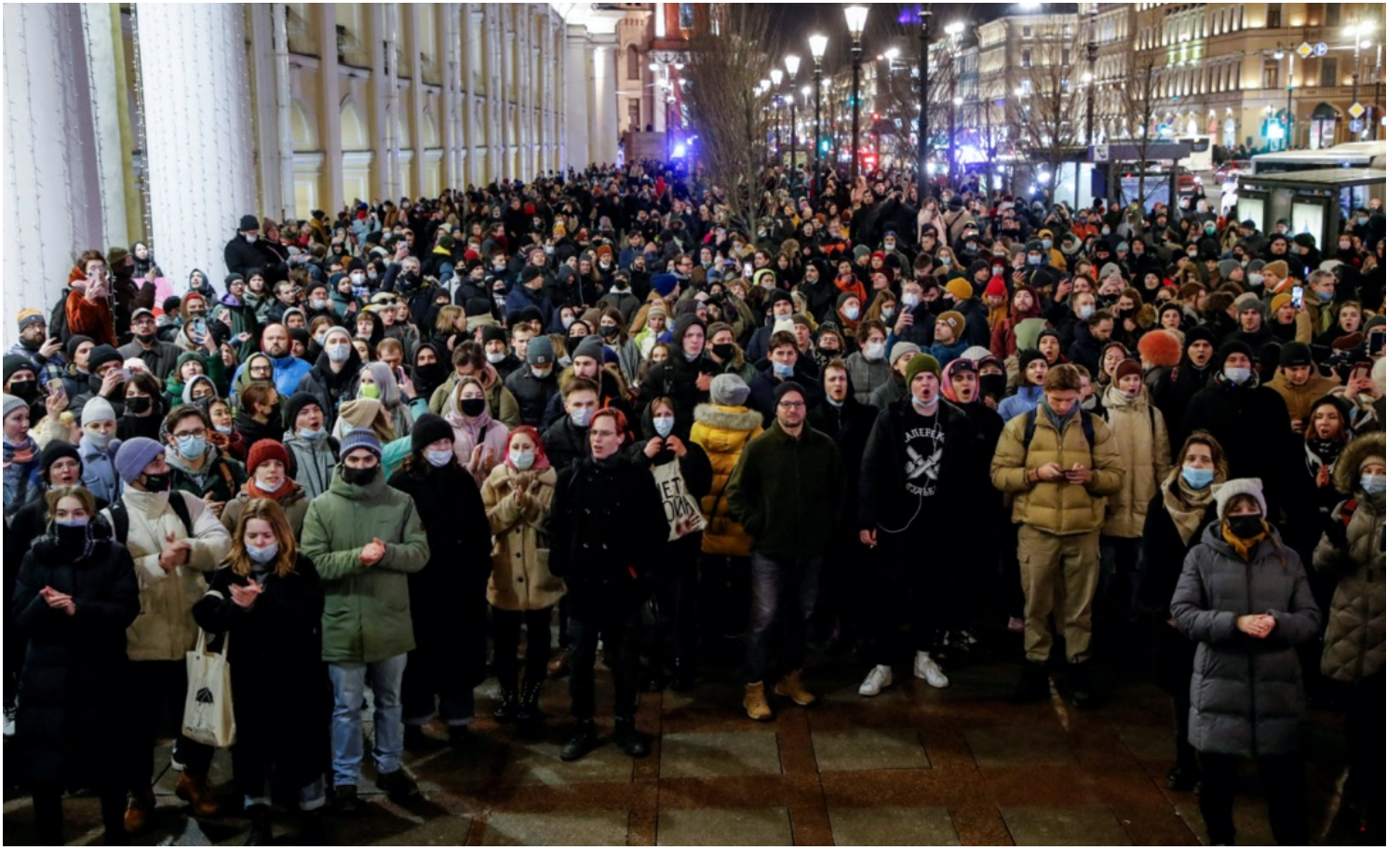
2022年2月24日，俄罗斯城市圣彼得堡，民众到市中心参加反战示威。