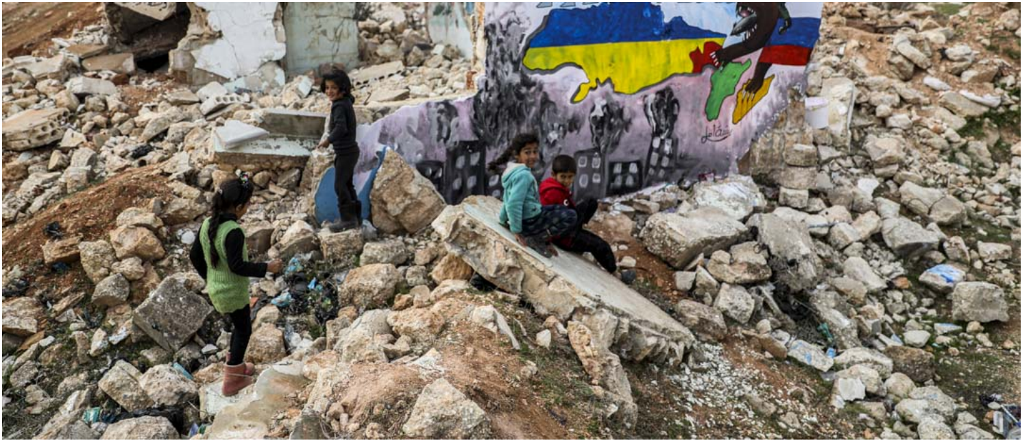
2022年2月24日，叙利亚宾尼什，俄罗斯入侵乌克兰后，叙利亚儿童坐在一幅为声援乌克兰而绘制的壁画旁。