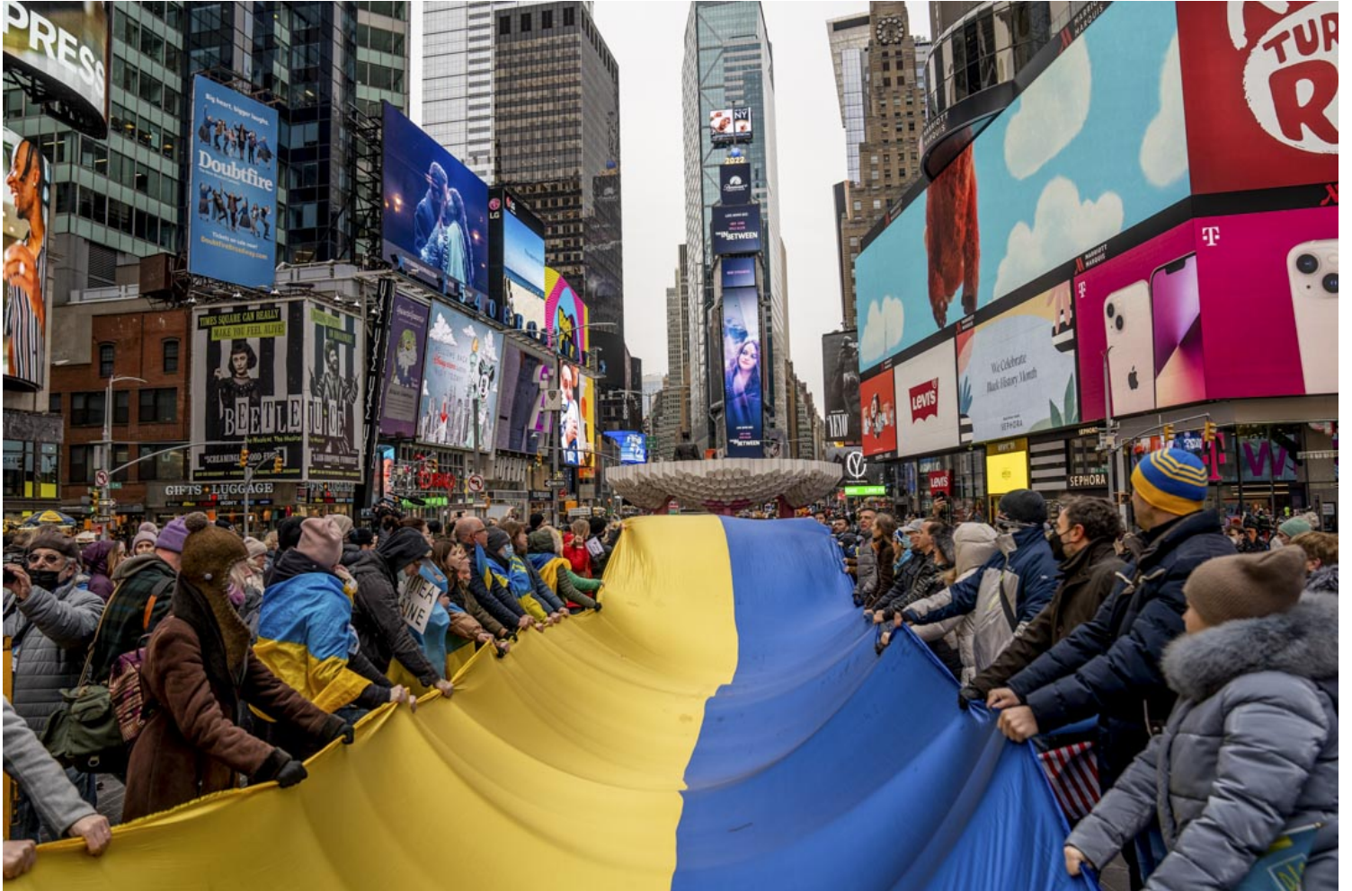
2022年2月24日，美国纽约，示威者在时代广场附近举行反俄罗斯入侵乌克兰的示威活动，民众举著乌克兰国旗横幅。