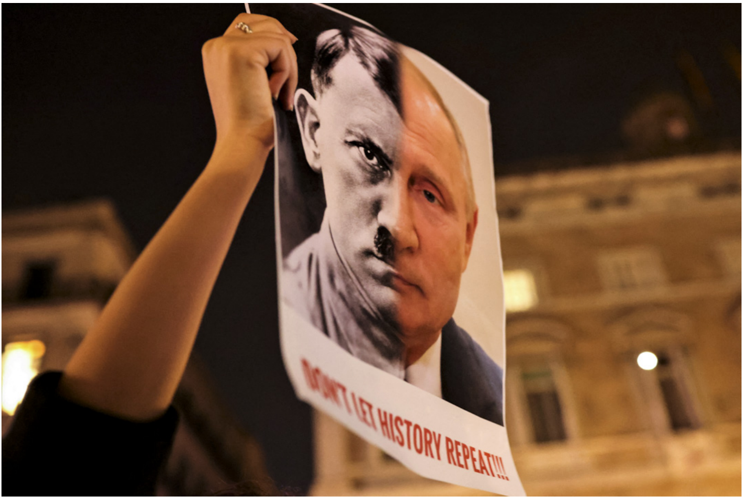
2022年2月24日，西班牙巴塞罗那，俄罗斯总统普京对乌克兰进行大规模军事行动，一名示威者举著横幅，上面印有普京和希特勒的肖像。