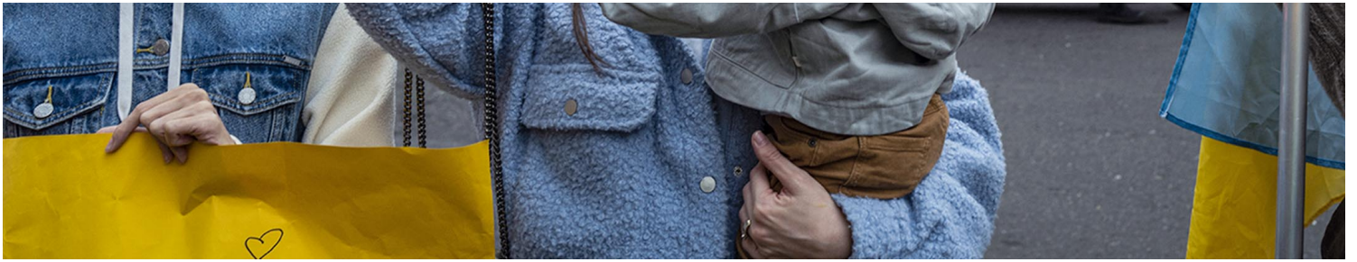
2022年2月25日，台湾台北，台北莫斯科经济文化合作协调委员会驻台北代表处前，民众下午举行小型集会，数十名民众，包括在台的乌克兰人，带同反战的示威标语及乌克兰国旗，抗议俄罗斯入侵，声援乌克兰人。