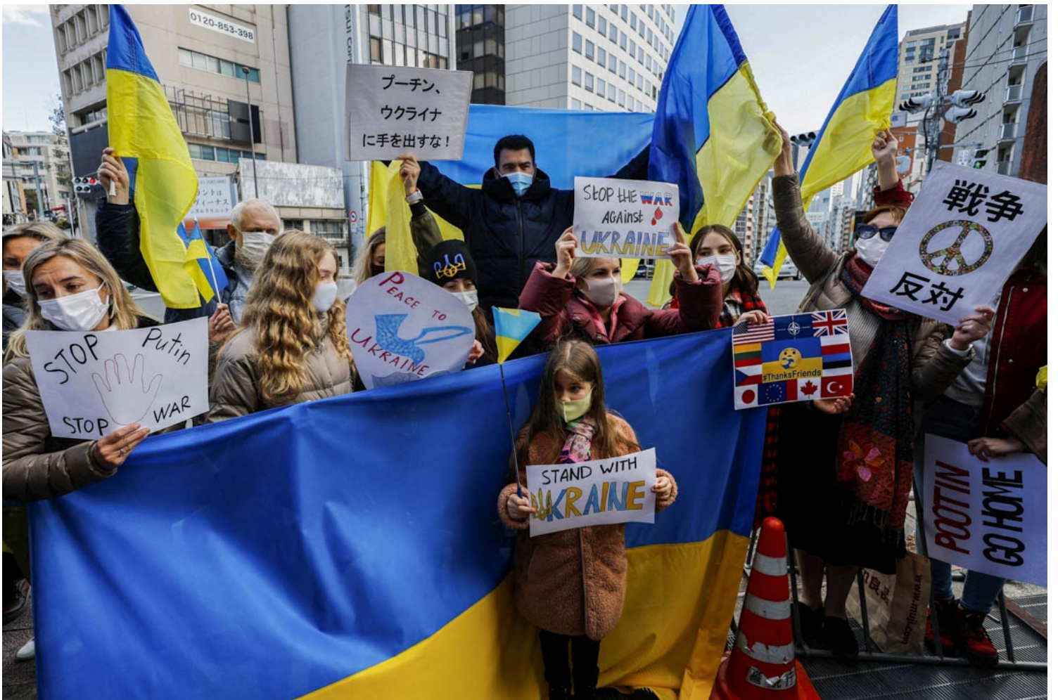
2022年2月23日，日本东京的俄罗斯大使馆附近，居住在日本的乌克兰人举著标语牌和旗帜，谴责俄罗斯入侵乌克兰。