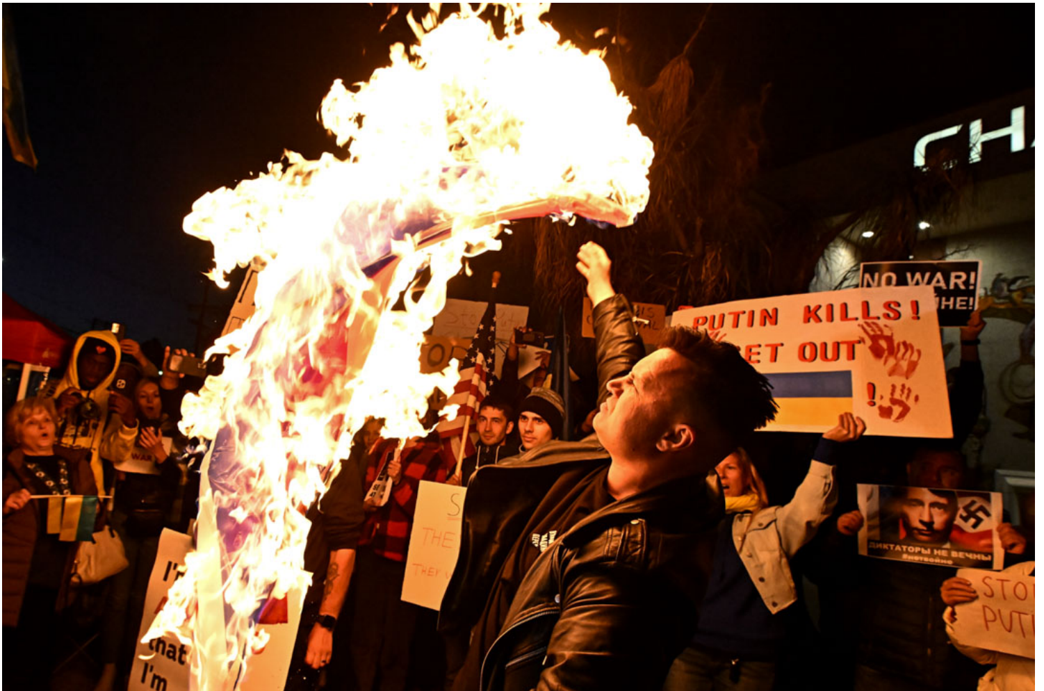
2022年2月24日，美国加利福尼亚州，一名男子在大通银行前举行反对俄罗斯入侵乌克兰的示威，并焚烧俄罗斯国旗。