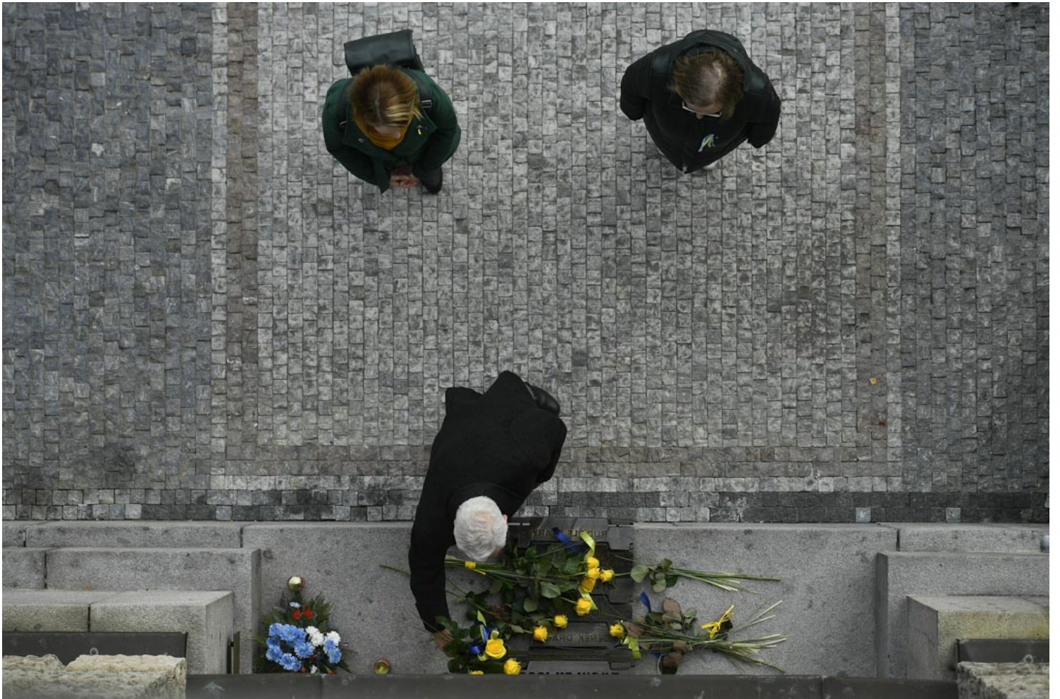
2022年2月24日，捷克利贝雷茨，示威者声援俄战火下的乌克兰人。