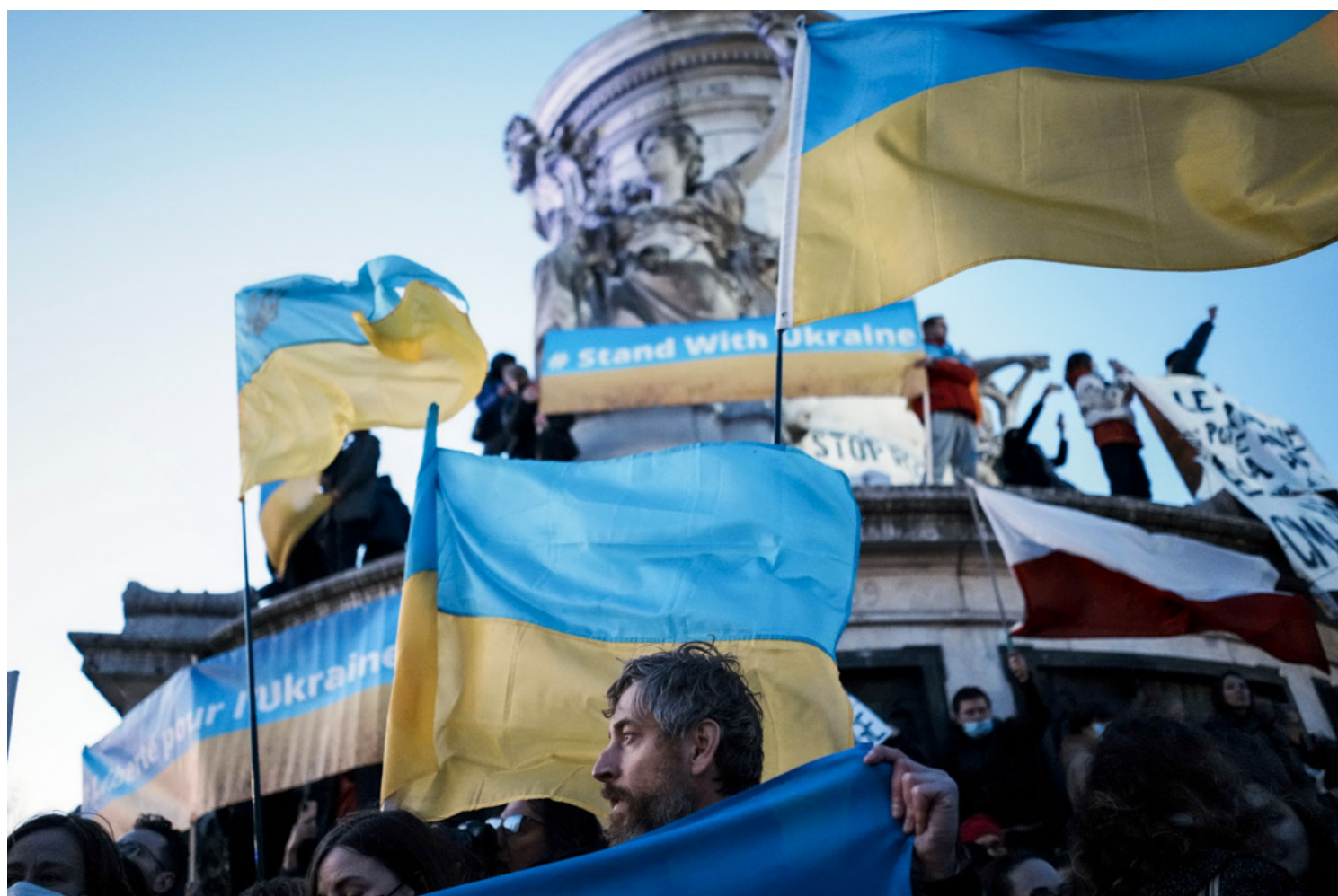
2022年2月24日，法国巴黎，示威者聚集并举起乌克兰国旗支持乌克兰人民。