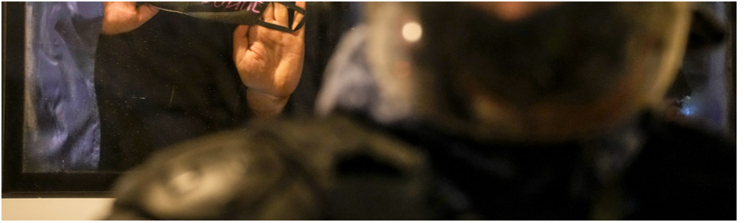
2022年2月24日，俄罗斯圣彼得堡，一名被拘留的示威者坐在一辆警车上，举著“禁止战争！”的反战标语。