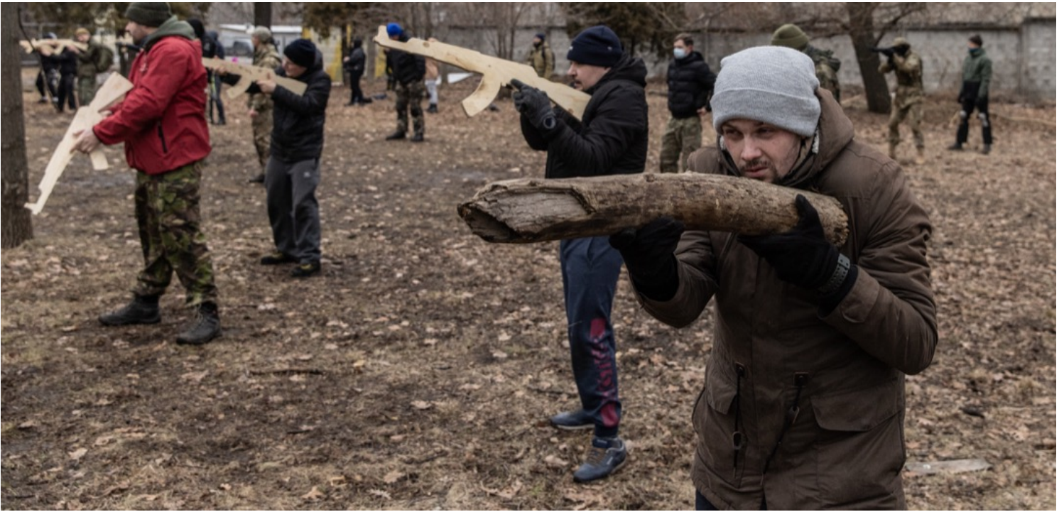
2022年2月19日，乌克兰首都基辅，平民参与一个由当地的领土防御部队举办的军事训练课程，参加者手持木制模型甚至树枝充当枪械练习。

尽管刚刚和俄罗斯签署了一系列新的合作项目的中南海已经表示中俄的“合作不设上限”。但是，北京一直以来也没有正式和俄罗斯成为军事同盟。尽管美国当下已经成为两国的共同“竞争对手”，但为了和美国对抗而支持俄罗斯在顿巴斯的行动，无异于北京要公开违背自己过往数十年以来标榜的不结盟形象，收获很可能远小于其损失。《华尔街日报》的最新报导就指出了北京的这一困境。其记者指出，北京希望在支持俄罗斯遏制北约东扩的同时不恶化和美国之间的关系。这使得北京采取了一种“既支持俄罗斯声讨美国，也反对俄罗斯进军乌克兰”的立场。于是，在慕尼黑安全论坛上，外交部长王毅就公开表示，支持乌克兰的主权和领土完整不受侵犯。而回过头来，在安理会上北京的发言则强调要解决各方的“关切”——言下之意是俄罗斯阻止北约东扩的需求也很合理。