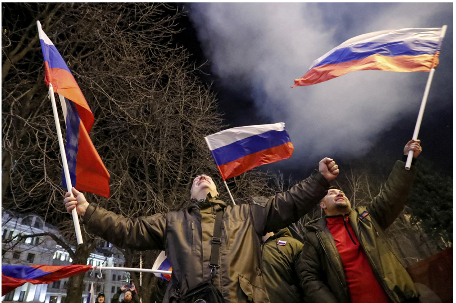
2022年2月21日在乌克兰顿涅茨克，有亲俄民众庆祝当地获俄罗斯承认为独立的“人民共和国”。

但是，相比之前的论文，普京的演说对欧洲的预期似乎到了历史的低点。法国总统和德国总理的接连斡旋似乎没有得到普京的认可。另一方面，通篇讨论乌克兰，也很明确地给出一个信号：俄罗斯此次的地缘政治目标完全是针对乌克兰——不一定要吞并，但是一定要按照俄罗斯的设想重新“安排”乌克兰这个国家。只不过，我们可以观察：普京会如何、在多大程度上、以多大力度介入乌克兰。