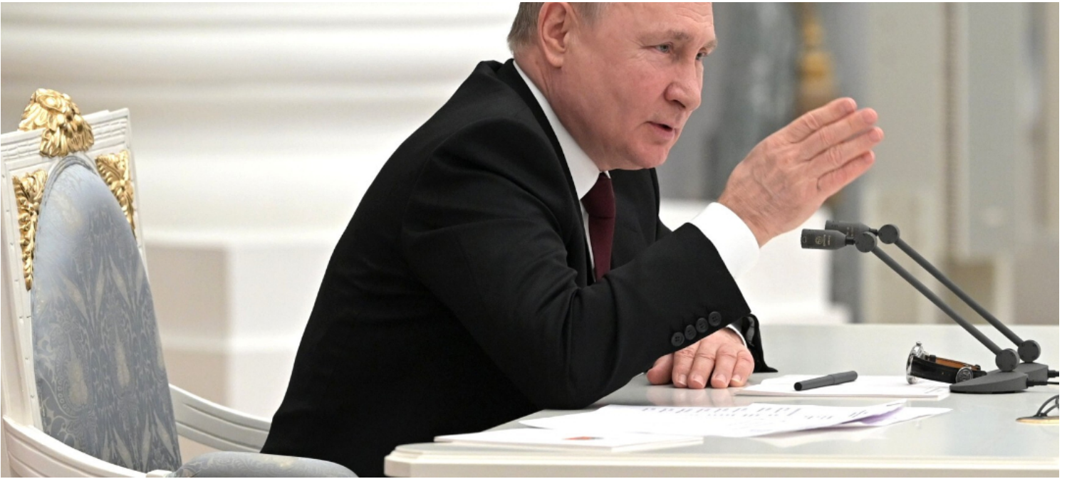
2022年2月21日，俄罗斯莫斯科克林姆林宫，总统普京召开俄安全委员会会议。