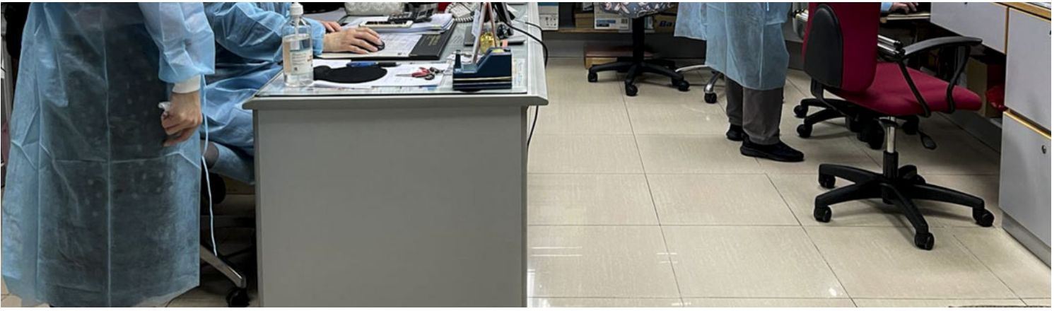
爆疫院舍内，职员全部穿著防护衣、帽，配戴两个口罩，严阵以待。