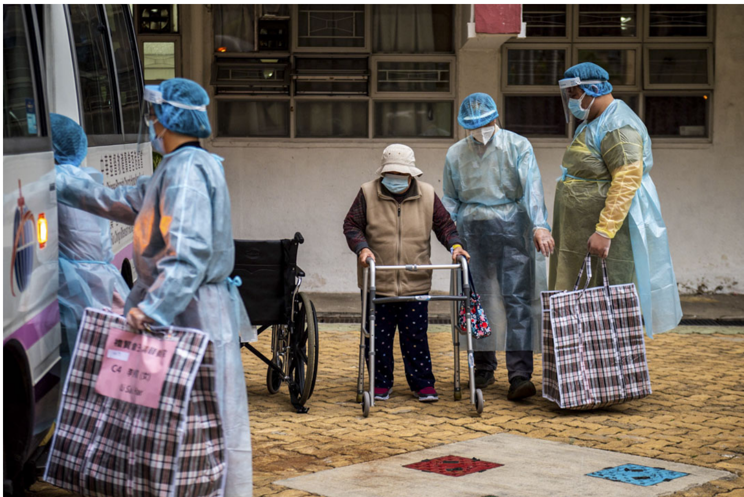
2022年2月9日，沙田的礼贤会王少清颐养院的长者由医护人员陪同撤离检疫。

由于租用商业土地，私营院舍一直面对租金和租期压力。加上要将商业用途的土地改建为安老院舍，要符合政府屋宇条例，例如每间房要有窗、采光，私营院舍往往无法间出很多有窗的独立房间，只能建成半开放式的大房设计，室内床位之间隔板通常1.2米高，不到天花板，符合通风要求；而院友的“私人空间”，则只有那张睡床和旁边一个小小柜子，有时连轮椅也没地方摆放。