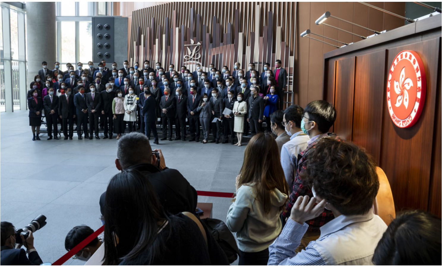
2022年1月3日，香港新一届立法会议员宣誓后，到立法会地下大堂大合照。