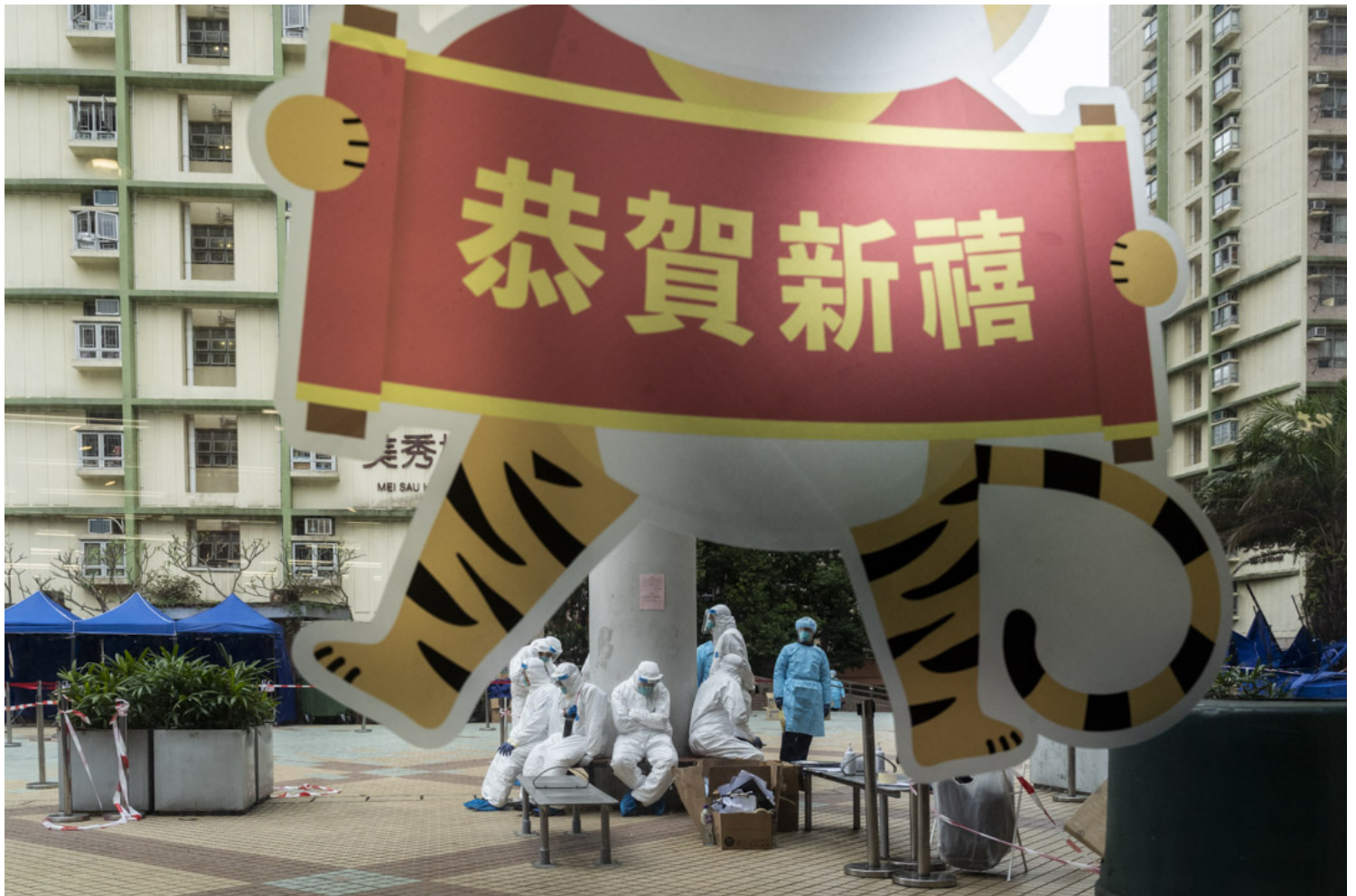
2022年2月7日，美田邨的围封强检地区，不少穿上保护衣的工作人员在休息。

国产疫苗则是另一个例子，香港首批100万只进口的疫苗就来自科兴。而在出现三人接种科兴疫苗死亡后，港府既没有暂停科兴的接种，也没有做进一步的检查。后来，在不断有研究证明科兴疫苗保护效力非常有限的情况下，港府依然提供了第三针科兴的选择。