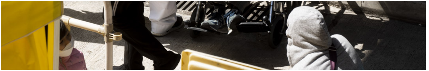
2022年2月14日，明爱医院急症室外有不少等候患者。