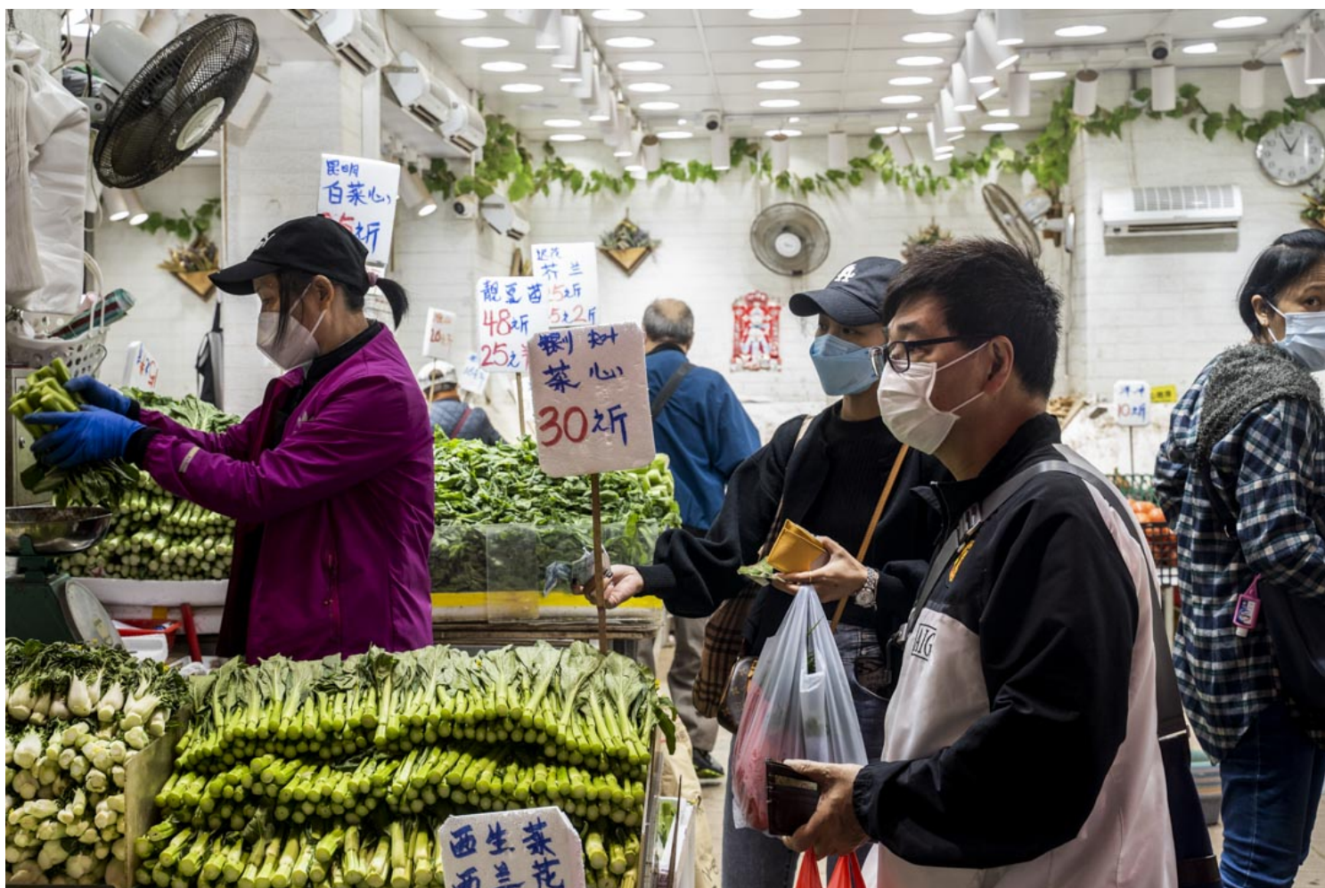
2022年2月8日，市民在旺角菜档买菜，菜价因疫情影响令菜价普遍上升不少。

反修例运动过后，民主派候选人尽数被清算，以至于在2021立法会选举中中央不得不允许一些边缘力量入闸参选以装点门面。至此，立法会的反对派不复存在，而三分之一立法会成员是现任人大或政协委员。与此同时，一批与传统建制派疏离，在本地缺乏根基，主要依靠北京的支持得以通过选委会界别登上舞台的议员逐步浮现出来，比如张欣宇，洪雯，陈凯欣等。运动后在北京的支持下港府还发起了对不顺从的“黄丝法官”的清理运动。国安法通过后，数名终审法院非常任法官提出辞呈不愿再获委任。