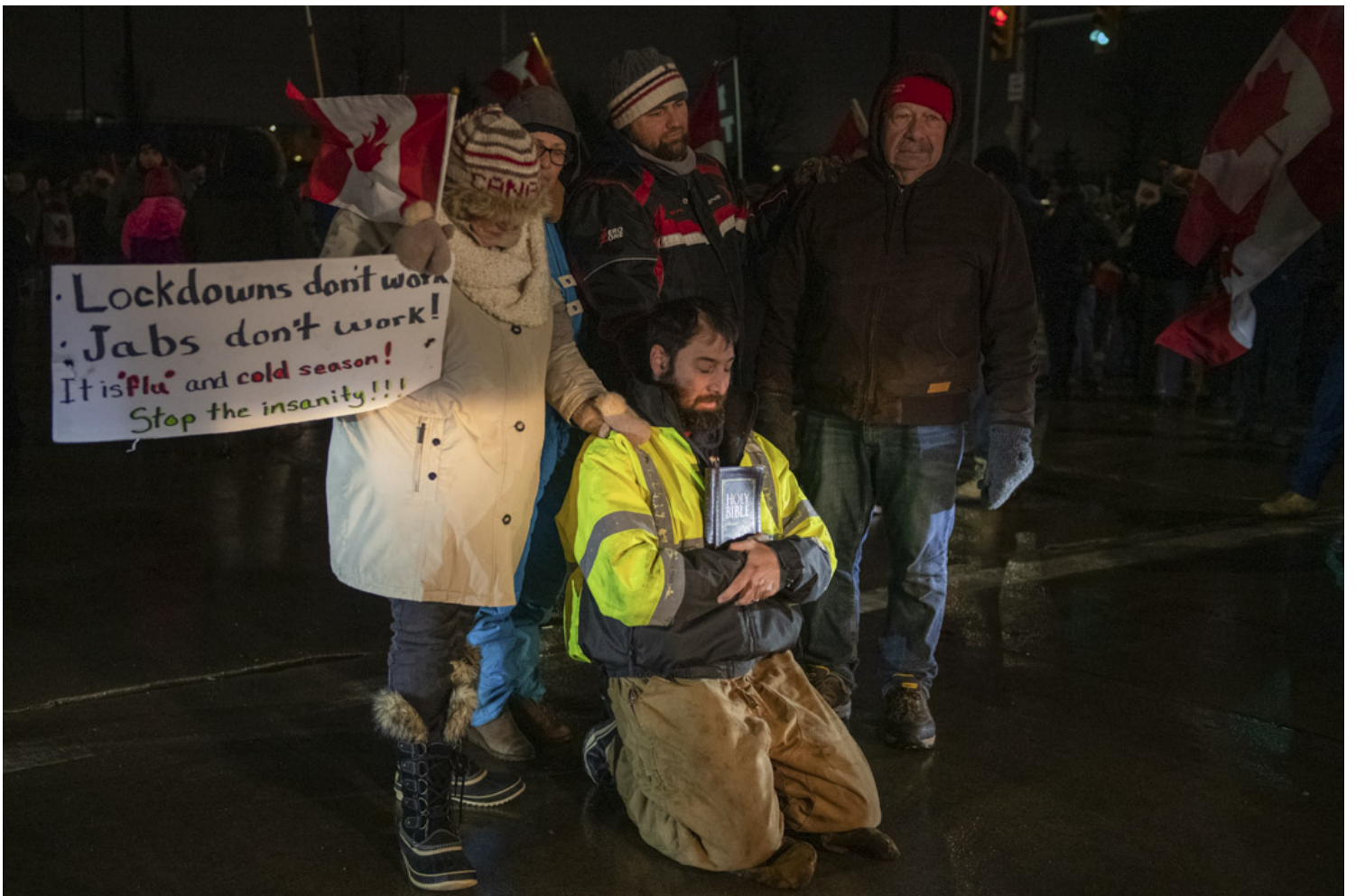
2022年2月11日，加拿大安大略省温莎市，数名“自由车队”反疫苗示威的参与者在路中心祈祷，连同其他示威者一起堵塞连接美国的大使桥。