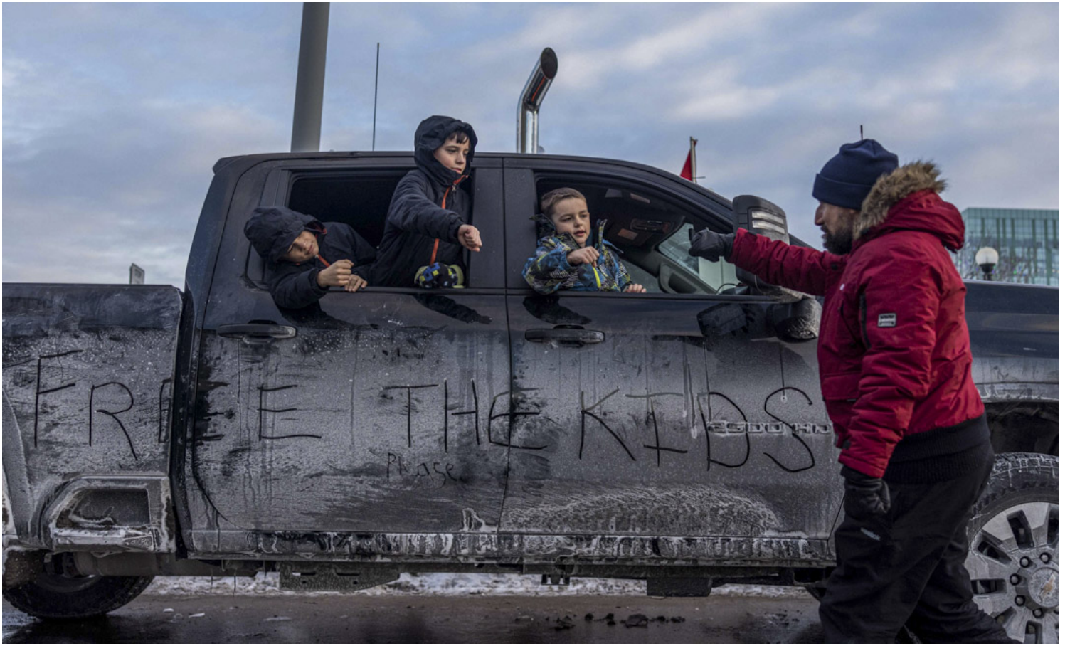
2022年1月30日，加拿大首都渥太华，三名小孩从一辆停泊在路边的车上向一位反疫苗示威者打招呼。