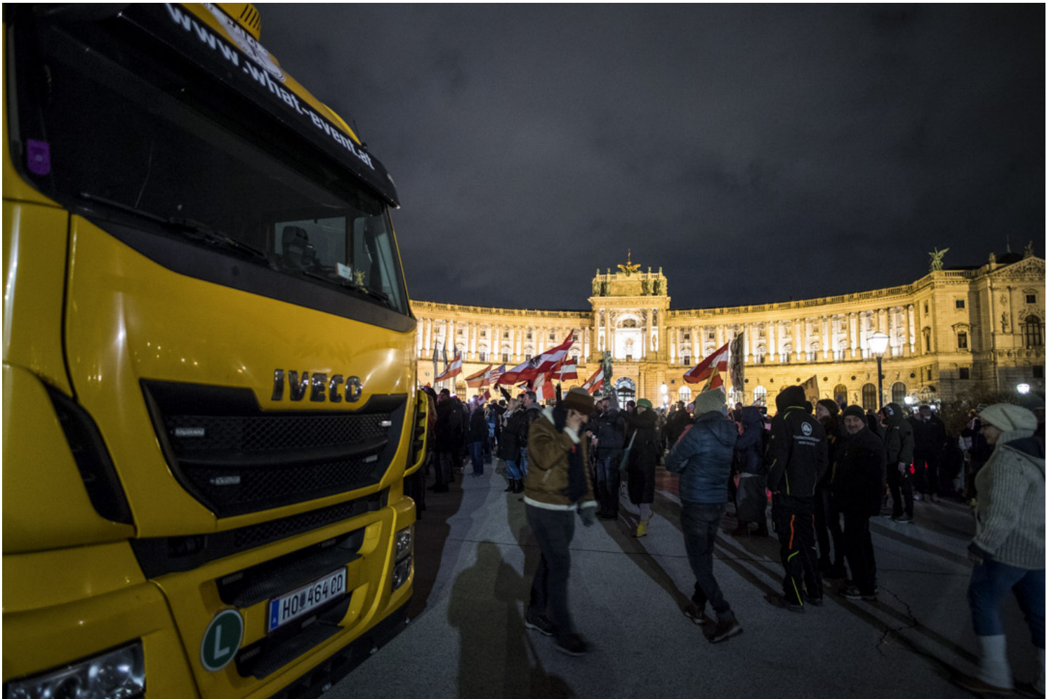
2022年2月11日，奥地利首都维也纳，受加拿大“自由车队”反疫苗示威感染，当地民众到市中心抗议政府封城、疫苗接种等防疫措施。