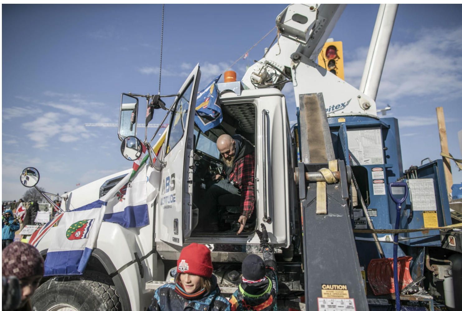
2022年2月7日，加拿大首都渥太华，参与“自由车队”反疫苗示威的货车司机在国会山庄外集合。

“自由车队”在加拿大各大公路上以车队行进堵路的方式示威，除渥太华外，还在多伦多、魁北克市和卡尔加里等其他城市举行了抗议活动。在抗议的前11天里，卡车的喇叭声每天长响达16个小时。2月7日，渥太华市长沃森宣布进入紧急状态。