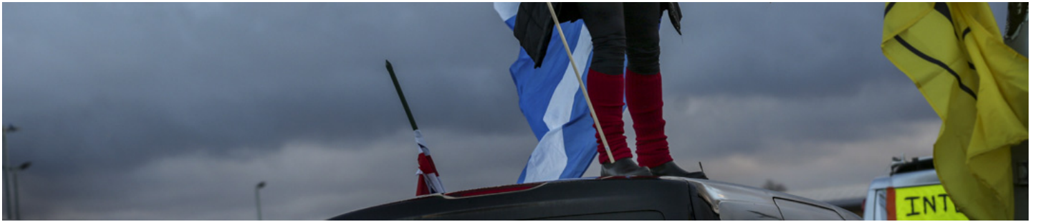
2022年2月6日，英国，首都伦敦市郊小镇科巴姆，一名反疫苗示威者站在自己的小型货车上挥动威尔斯和苏格兰国旗。