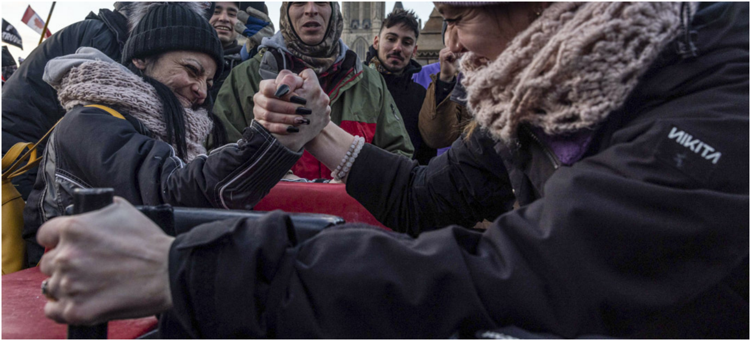
2022年1月30日，加拿大首都渥太华，两名反疫苗示威者在国会山庄外拗手瓜。