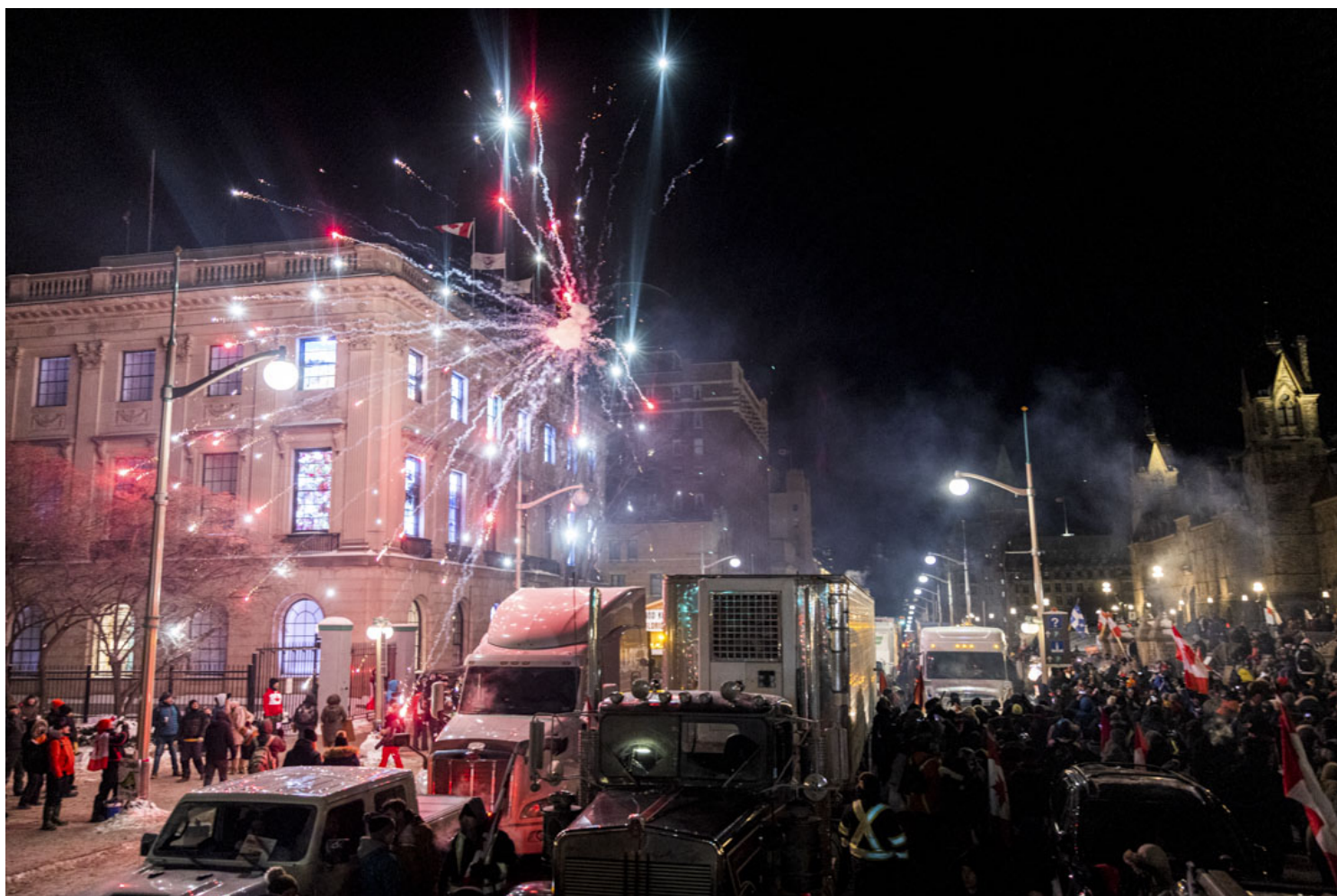
2022年1月29日，加拿大首都渥太华，国会山庄外的反疫苗示威持续，有示威者向天放烟火。

然而，加拿大卡车运输联盟（Canadian Trucking Alliance）谴责示威，并表示已接种疫苗的卡车司机占比达85%，因此最新的疫苗要求只会影响少数人。