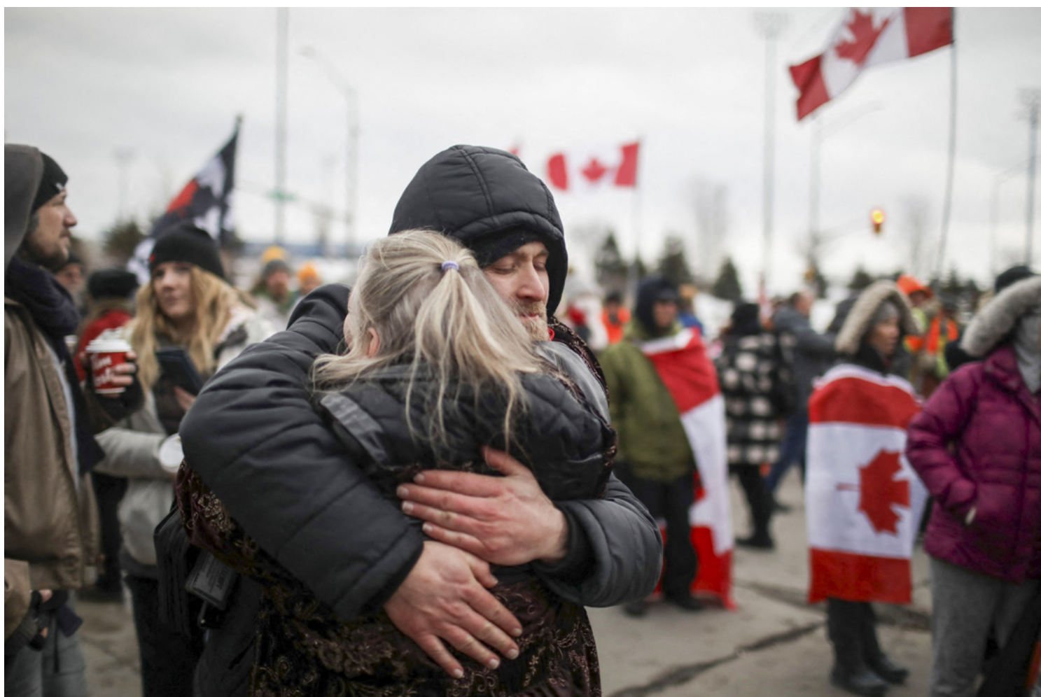
2022年2月10日，加拿大安大略省温莎市，“自由车队”反疫苗示威参与者堵塞通往美国的大使桥，两名示威者在拥抱。

“自由车队”运动已向世界蔓延，在法国、新西兰、澳大利亚和美国引发了类似的示威风潮。