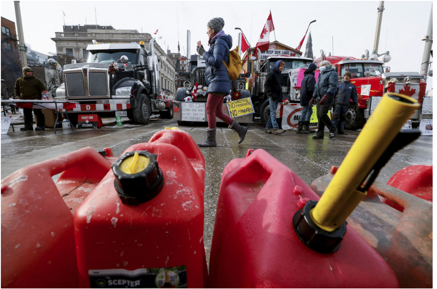
2022年2月9日，加拿大首都渥太华，货车车队接连抵达国会山庄外，参与“自由车队”反疫苗示威。