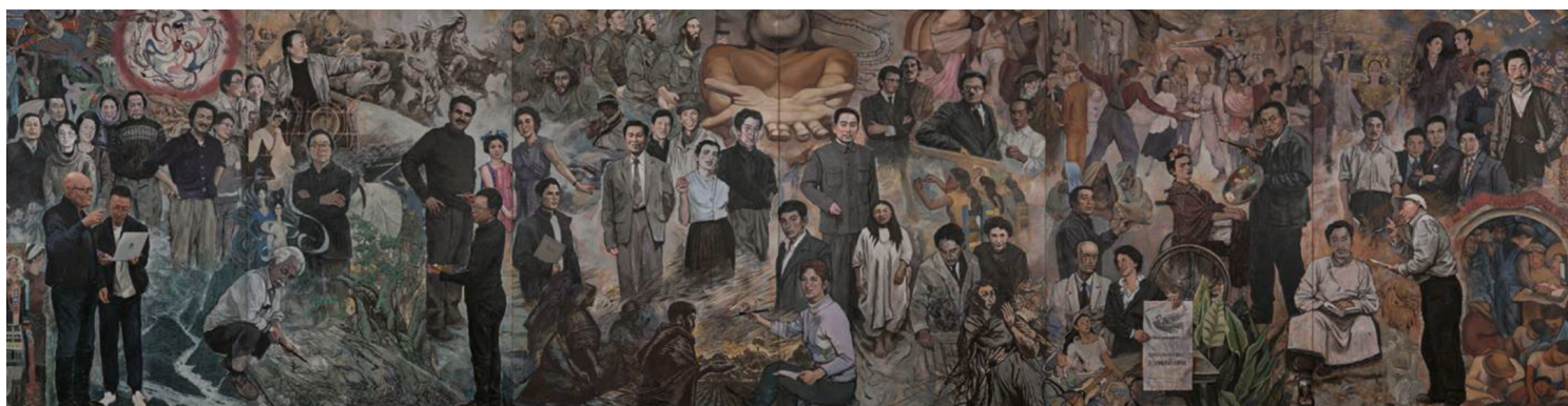
大型壁画《风起扶桑》。

郑：艺术在任何时代都以各种各样的方式来延续。每个具体的艺术家都有所不同，有些艺术家可能表现形式上延续现实主义或现代主义，有些艺术家仅从他的创作风格中含蓄地体现这些特征。艺术家本人的人生总是从一个阶段过渡到另一个阶段，其作品也必然有延续。2009年，我在纽约办了一个规模较大的展览，关于社会主义时期艺术。这个展览题目叫“Art and China’s Revolution”（艺术与中国革命）。除却展览大批样板作品，包括油画、雕塑，比如《收租院》、陈逸飞的《黄河》等作品之外，我们特别选了徐冰和罗中立两位艺术家的速写。我去借来了他们画的速写本，放在陈列柜中展览。通过这两人的艺术创作和习作，让观众看到艺术家身上以及他们的作品中对过去经历的延续。