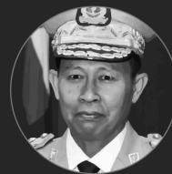
梭温副大将 Soe Win