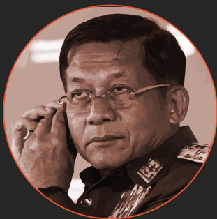
敏昂莱大将 Min Aung Hlaing