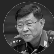
妙吞吴上将 Mya Tun Oo