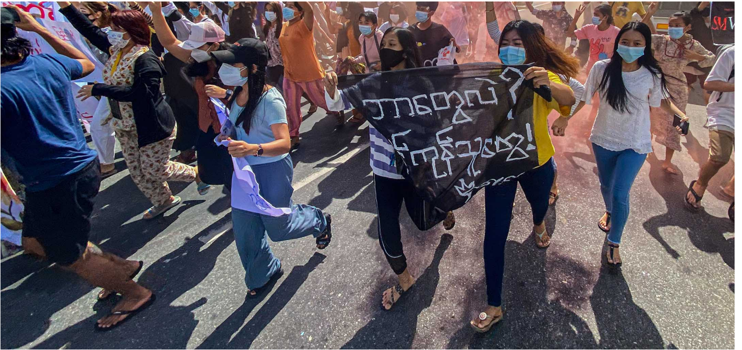
2021年7月14日缅甸仰光，仰光举行的反政变示威的游行中，妇女手持横幅和紧急信号棒。