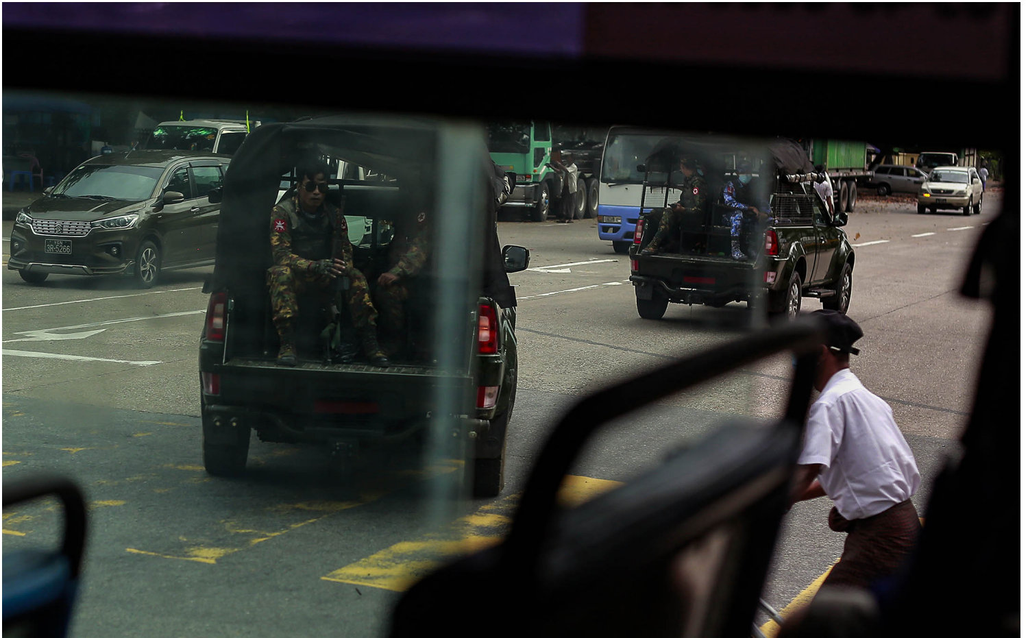
2021年10月13日，武装士兵在缅甸仰光的街道上巡逻。