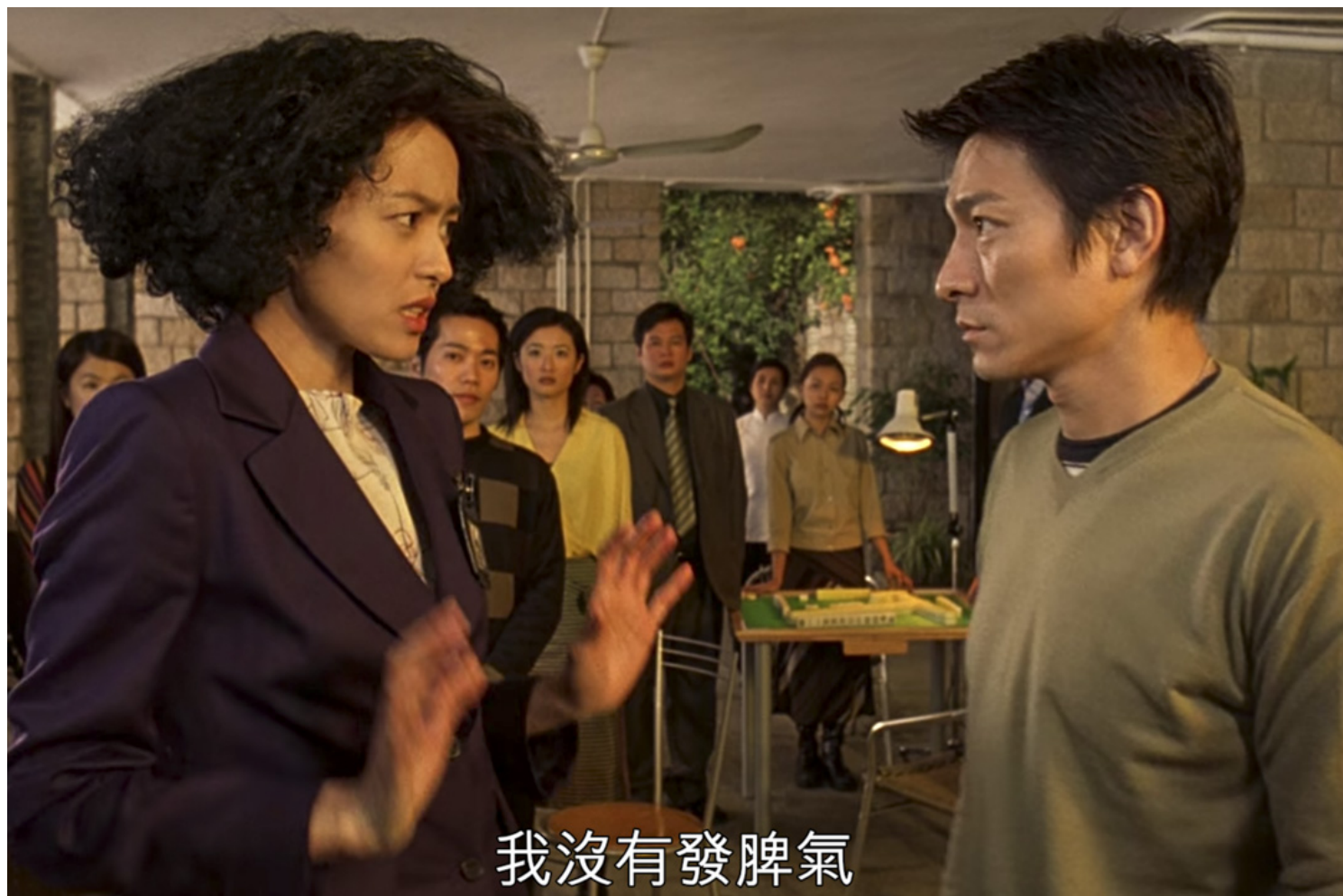
《呖咕呖咕新年财》电影剧照。影片截图

低成本拍摄，再以各种本土情怀、香港精神作为包装的贺岁片，便取代了低质而没有观众缘的杂种合拍片，但其实质素亦没有很高。