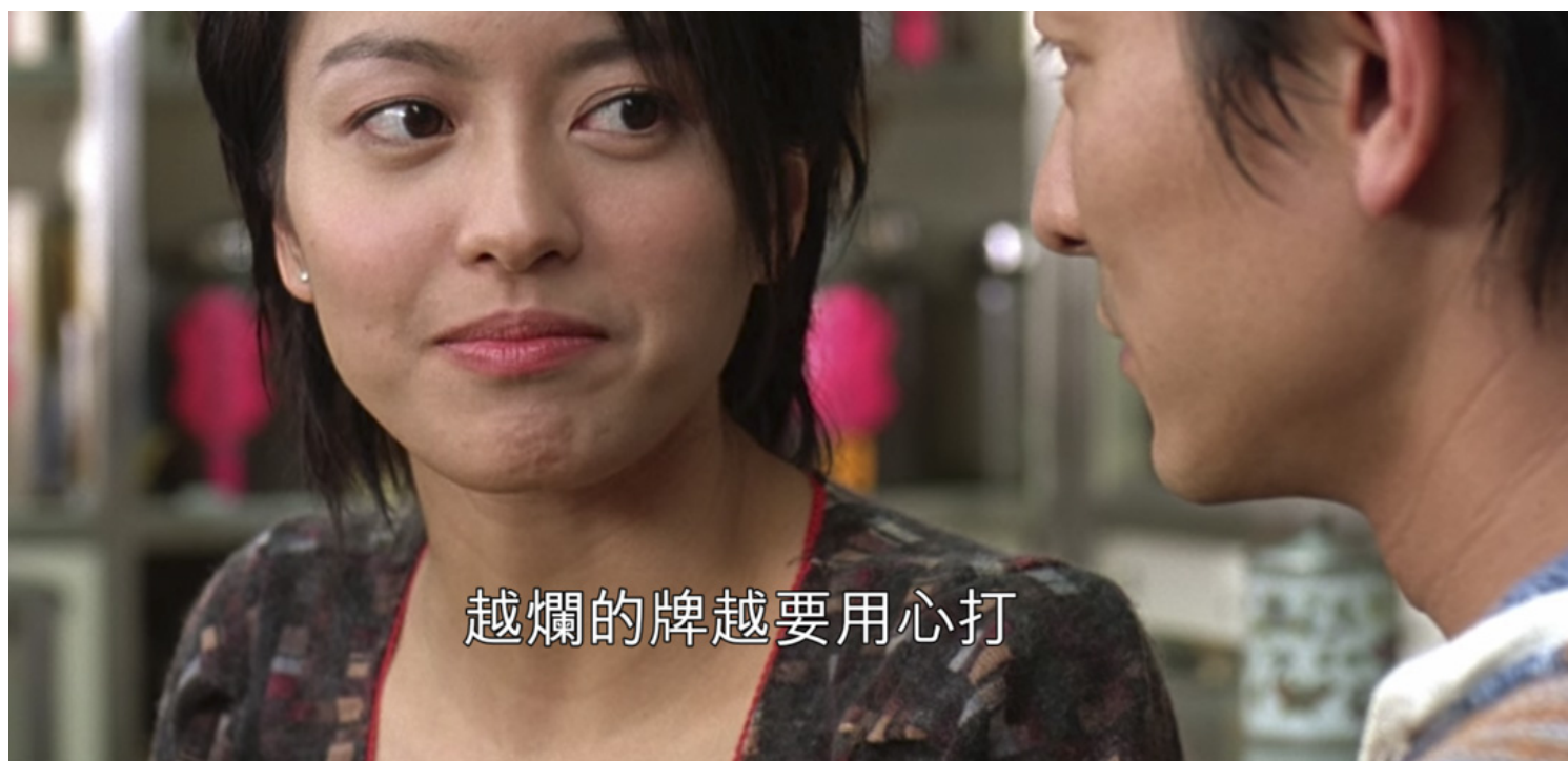
《呖咕呖咕新年财》电影剧照。影片截图