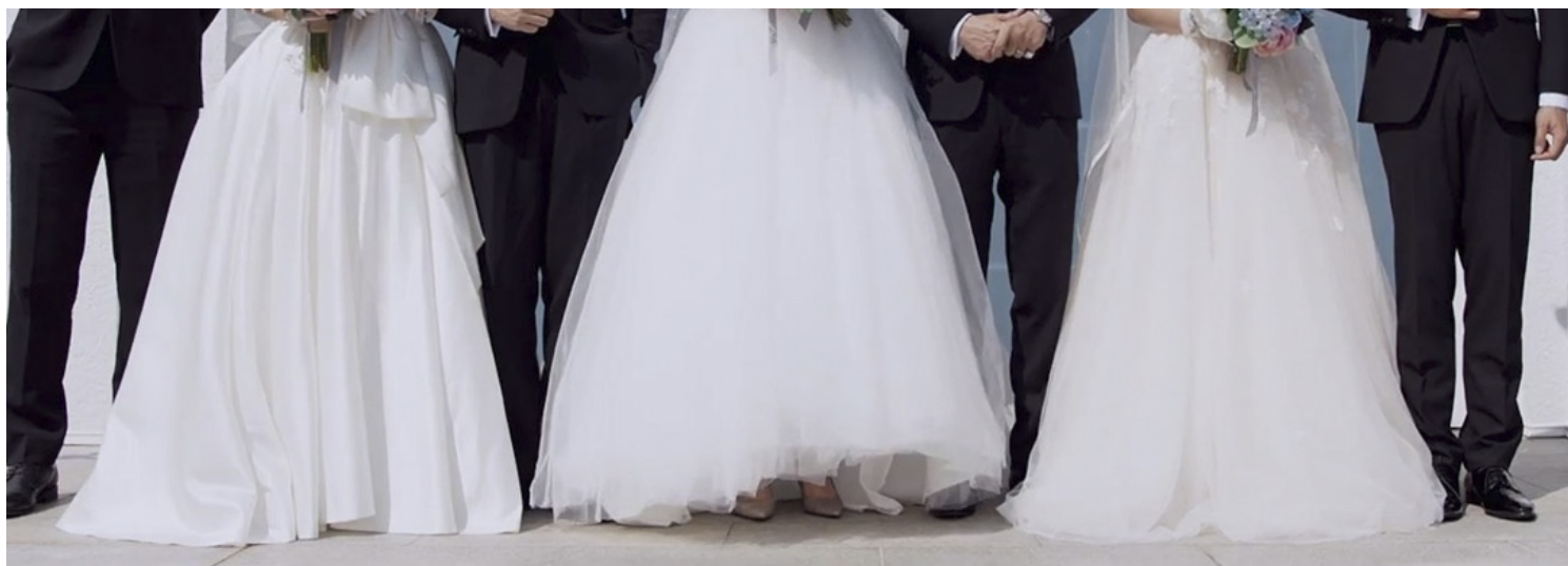
《家有囍事 2020》电影剧照。网上图片