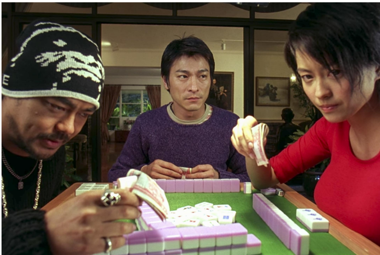
《呖咕呖咕新年财》电影剧照。影片截图

烂牌时代，确已经失去优势，很多人选择弃牌离场，但始有人会留下继续打继续挨。输只是一局，但牌品是意志，留在心里是一世。