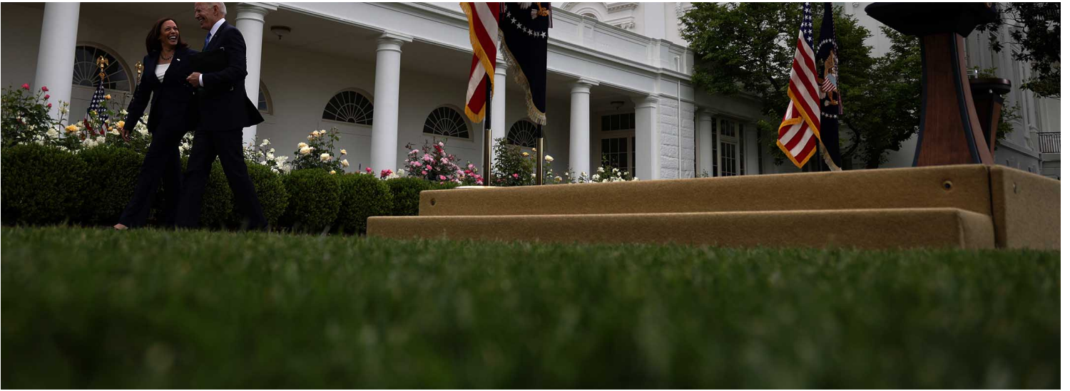
2021年5月13日华盛顿，美国总统乔·拜登于白宫应对疫情及疫苗接种计划发表讲话。

一年后，康诺顿被调到芝加哥，他厌恶寒冷的天气并想念南部生活，便放弃两万元的奖金，在一九八五年初跳槽到位于亚特兰大的证券经纪商赫顿公司（E. F. Hutton）。几个月后，新公司在一次大规模的支票诈欺丑闻中向两千项邮电诈欺罪状认罪。整个八〇年代，赫顿公司一直在开空头支票，无法兑现庞大的金额，并在多个帐户之间转移资金，再将这笔钱用于无息贷款，短短一两天内就利用浮差赚取上百万元。在华府，担任参议院司法委员会成员的拜登开始调查此案件，他在电视节目上讨论华尔街的白领犯罪活动日益肆虐，以及雷根政权底下的司法部失责，无法制止白领犯罪。他在纽约大学的演讲中提到：“大家都认为我们的法律体系对高层人员不道德或非法行为的管制失败了，或根本没认真尝试过进行有效的管制。”雷根在第二任期显得老态龙钟，执政团队充斥著贪污的气息，而拜登正准备竞逐大位。