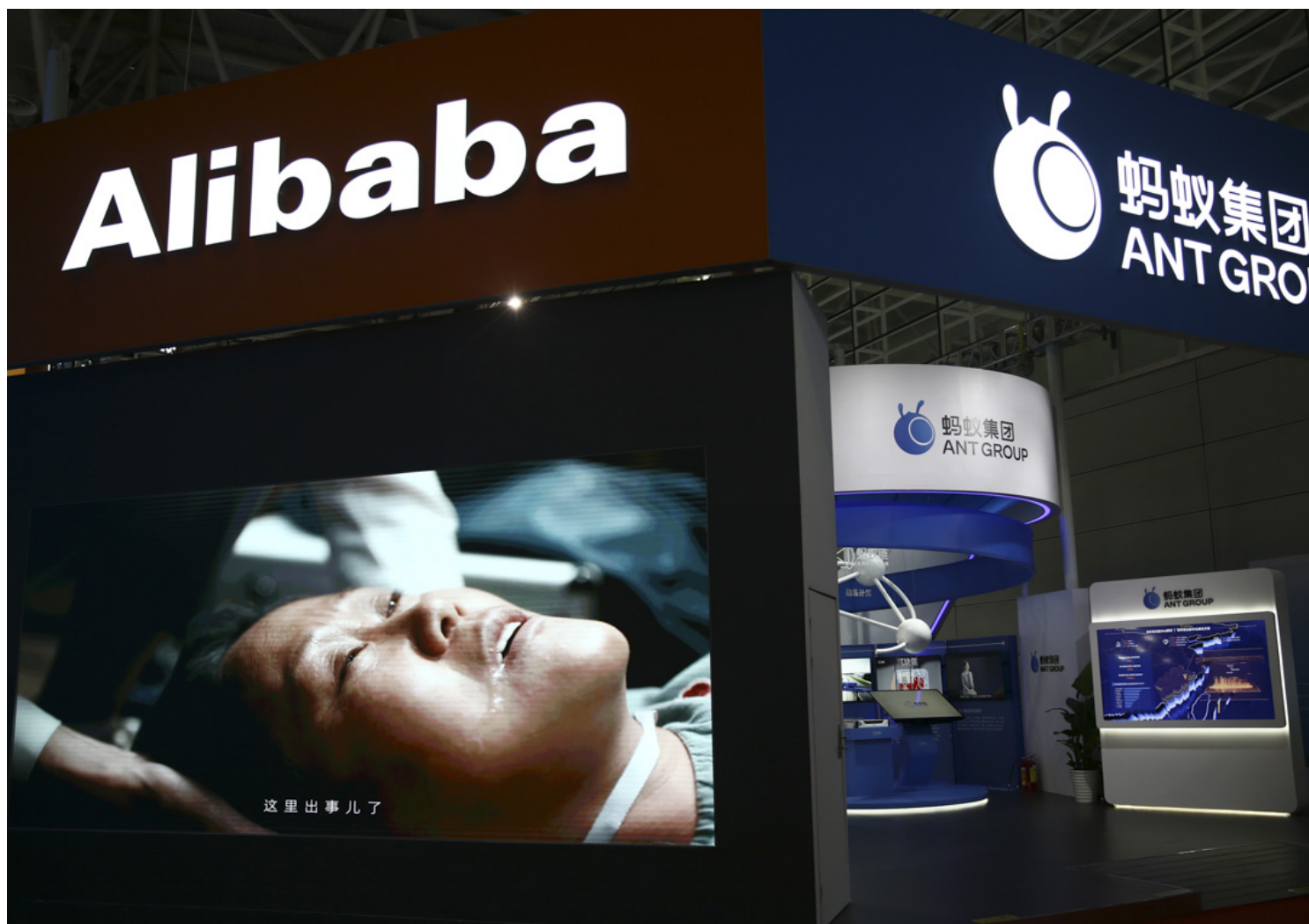
2021年4月25日，福州举行的第四届数字中国峰会期间在福州海峡国际会展中心举行，当中有阿里巴巴及蚂蚁集团的摊位。

同时，外媒在持续关注商业巨头和市场的走向，其报导的持续性、丰富度远超高层政治的报导。表现之一，就是被外媒比喻为中国“雷曼时刻”的、以房地产开发发迹的恒大集团所面临的危机。对于恒大危机，中国官方媒体 鲜有报导 ，但诸多外媒给予了持续关注。此次危机，不光是打击房产购买者和投资者信心，而是会造成金融体系崩溃，无法转嫁风险，可能会重蹈日本经济1989年泡沫破裂、持续低走的（又称“失落的二十年”）覆辙，这正是近些年中国“去杠杆”的必需所在，也是20年房地产经济高开低走的缩影。透过公司数据、其合作方和地方政府的举动，《华尔街日报》的报导显示，中国各级政府正在慢慢帮助消化恒大的“烂摊子”，废弃项目或是退回款项，而非注资，使其免于破产。而令外界担忧的是，中国无法公开其整治和重组计划，使得更为扑朔迷离。