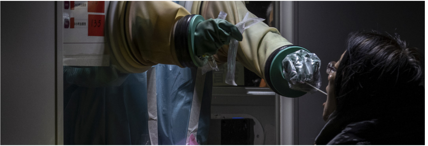
2022年1月13日，一名妇女在北京的一个私人检测点接受卫生工作者的 Covid-19 核酸检测。

疫情依旧是外媒关注的重点。中国草木皆兵、“零容忍”的高压管控，体现在“ 1人被确诊，全城被封锁 ”，“ 柯基被扑杀 ”等新闻中，被视为是缺乏人性，且代价过于高昂， 不可持续 。其拒绝世界卫生组织的第二阶段疫情溯源，饱受争议。同时，中国国产的疫苗功效，常被爆出不尽人意。在观察者看来，疫情正是党国在经济疲软、外交受困之时，展示执政合法性、重塑国内外威信证明。