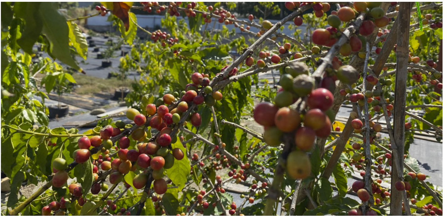
种了5年的咖啡树，去年底开始结果，在冬日阳光下挂了一串串咖啡果实。

采收后，她会使用半水洗法处理咖啡豆，先剥掉咖啡果实外皮，收集有两颗白色的“生豆”，生豆被一层黏膜包围，要拿去清洗干净，把未成熟的果实捞走，再把其余的收成浸在水中发酵约一天，溶除表面果胶后再冲洗，再放在太阳下曝晒再剥去剩余果肉，提取种子。