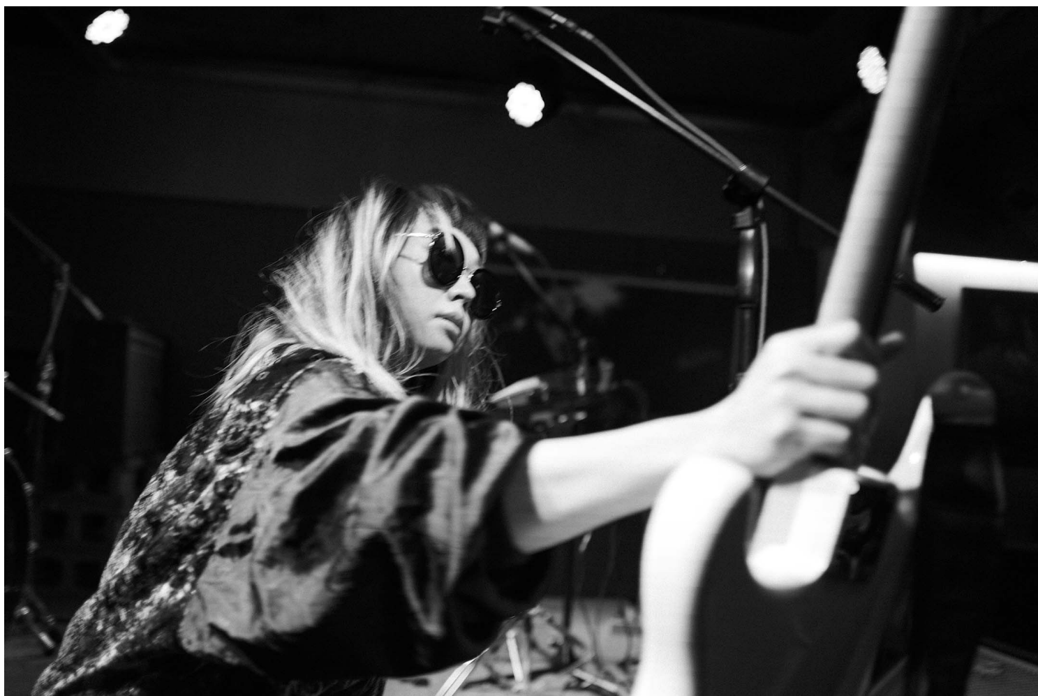
2021年12月18日台北，香港乐队绝命青年在台上表演。

2021年4月，与很多香港人一样，“绝命青年”选择踏上漂泊旅途，寻求另一种生存方式。然而在塞满音乐设备的行李中，却连一件冬衣也没有。“我本身以为年底还有机会回到香港，现在看来是没可能了。”