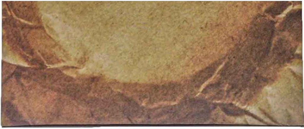
乐队“鸡蛋蒸肉饼” (GDJYB) 首张同名EP。

“鸡饼”十年，演出足迹不止于亚洲，更远的澳大利亚、美国、乃至冰岛全都去过。但在瘟疫时期，台港之间短短1.5小时的飞行距离，却显得“这么近，那么远”。“原本希望我和Soni留在台湾，‘鸡饼’另一团员、贝斯手Wing就在台港两边走，但现时情况不容许。现在只要一来台湾，就是一次long-term stay了。”Soft说。