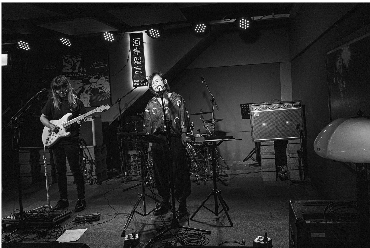
2021年12月18日台北，香港乐队绝命青年在台上表演。

又如香港有工厦band房文化，独立乐队多数都会长租一间斗室来“夹band”，band房可以作为相对稳定的聚脚点；而台湾的练团室已具规模，因此要练团，则多数要租用市面上的rehearsal room，“除非是经营了一段时间的乐团，或者自己搭一间房子来搭band房，但始终比较少。”Soft直言目前尚未熟悉台湾的工作模式：“我们也在向一些音乐人或其他幕后策划人请教更多，这一年会继续努力，慢慢深入，认识这里的文化多一点，才能够了解他们如何运作。不急的。”