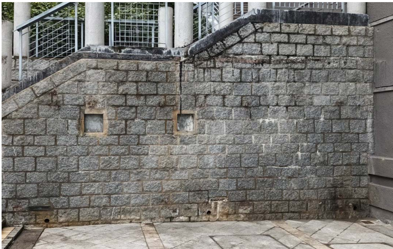
2021年12月24日早上5时，香港岭南大学梁 琚教学楼旁的“六四浮雕”被拆卸。

除雕像之外，他提到校方清除的目标还包括了自九十年代末因应主权移交在即，学生会成员在学生会长墙上画上的民主女神画像。他认为此次各院校接连清除六四纪念品的行动，很有可能是多间大学的行政部门的一致行动，但无论是受到强力部门的压力，抑或是自行邀功，“都是旨在清除人们对六四屠城的历史记忆”。