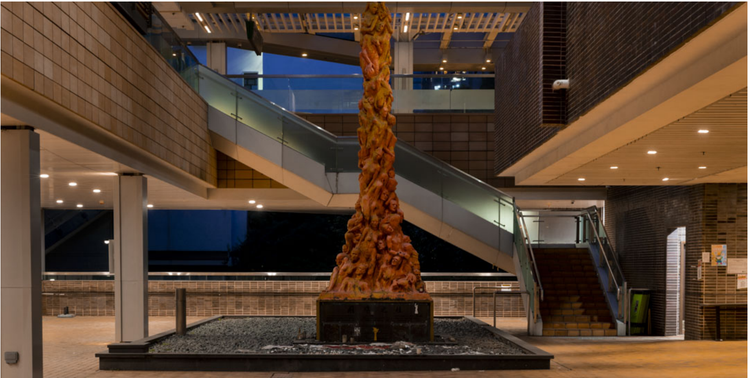
2021年12月23日凌晨，香港大学把悼念北京六四事件的雕塑《国殇之柱》围封及拆走。图片拍摄于2021年10月12日。