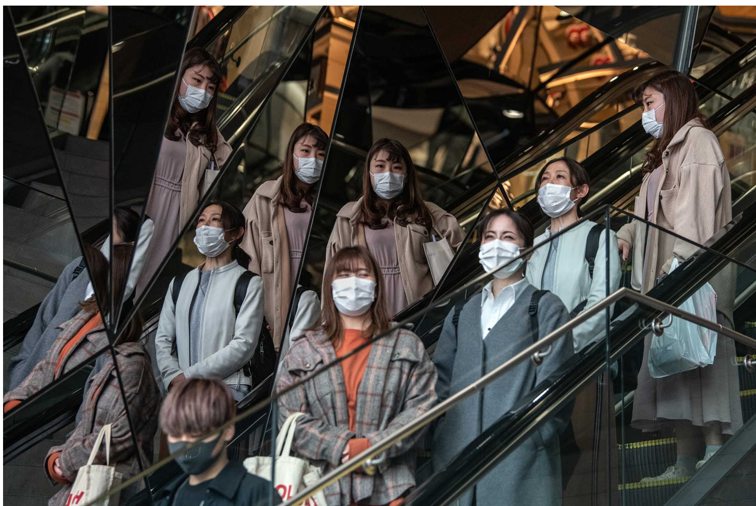
2020年4月3日日本东京，戴着口罩的人们从自动扶梯下楼。

作为日本保守主义的代名词，自民党反对夫妇选择别姓并不令人意外，但是在今年三月25日，自民党内别姓赞成派议员发起成立了“选择夫妇别姓早期实现自民党议员联盟”，有一百位以上自民党籍议员表明参加这个议员联盟。其中就包括现任的自民党总裁岸田文雄。由此可见，即使在保守的自民党内部，对待选择别姓的态度也并不是一味地反对，那么到底是什么原因导致了如今夫妇选择别姓的制度难以推进的局面？