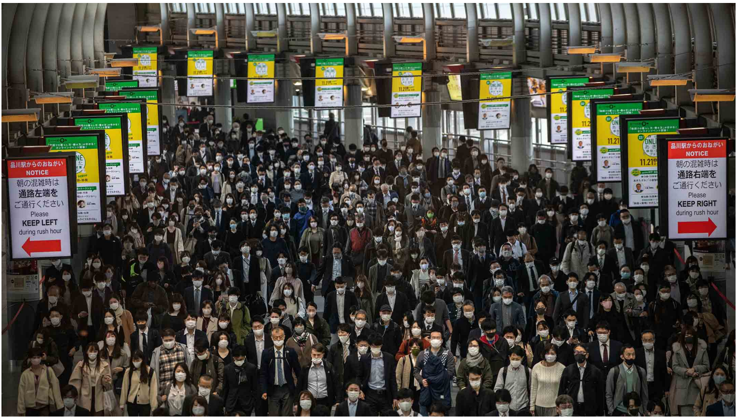
2020年11月18日日本东京，市民戴着口罩穿过日本东京的品川火车站。

在日本，有一个积极推动选择夫妇别姓实现的市民团体“选择夫妇别姓全国陈情行动”和早稻田大学法学部棚村政行研究室在2020年十月份做了一项联合社会调查—《47都道府县“选择夫妇别姓”意识调查》（ https://chinjyo-action.com/47prefectures-survey/ ），在该调查中反对选择夫妇别姓（自己认为夫妇同姓是好的，并且其他夫妇也应该同姓）从全国来看只有14.4%，而赞成导入选择夫妇别姓（1. 认为自己选择同姓是好的，但是其他人可以有不同选择；2. 自己和别人都应该选择别姓）的回答者占到70.6%。除此之外朝日新闻在2020年一月份所做的舆论调查也显示，支持选择夫妇别姓的回答者超过六成。所以推动选择夫妇别姓有相当大的民意基础，但是遗憾的是，至今这样的民意并未反映在法律中。部分保守派议员从中起到了不可忽视的作用。