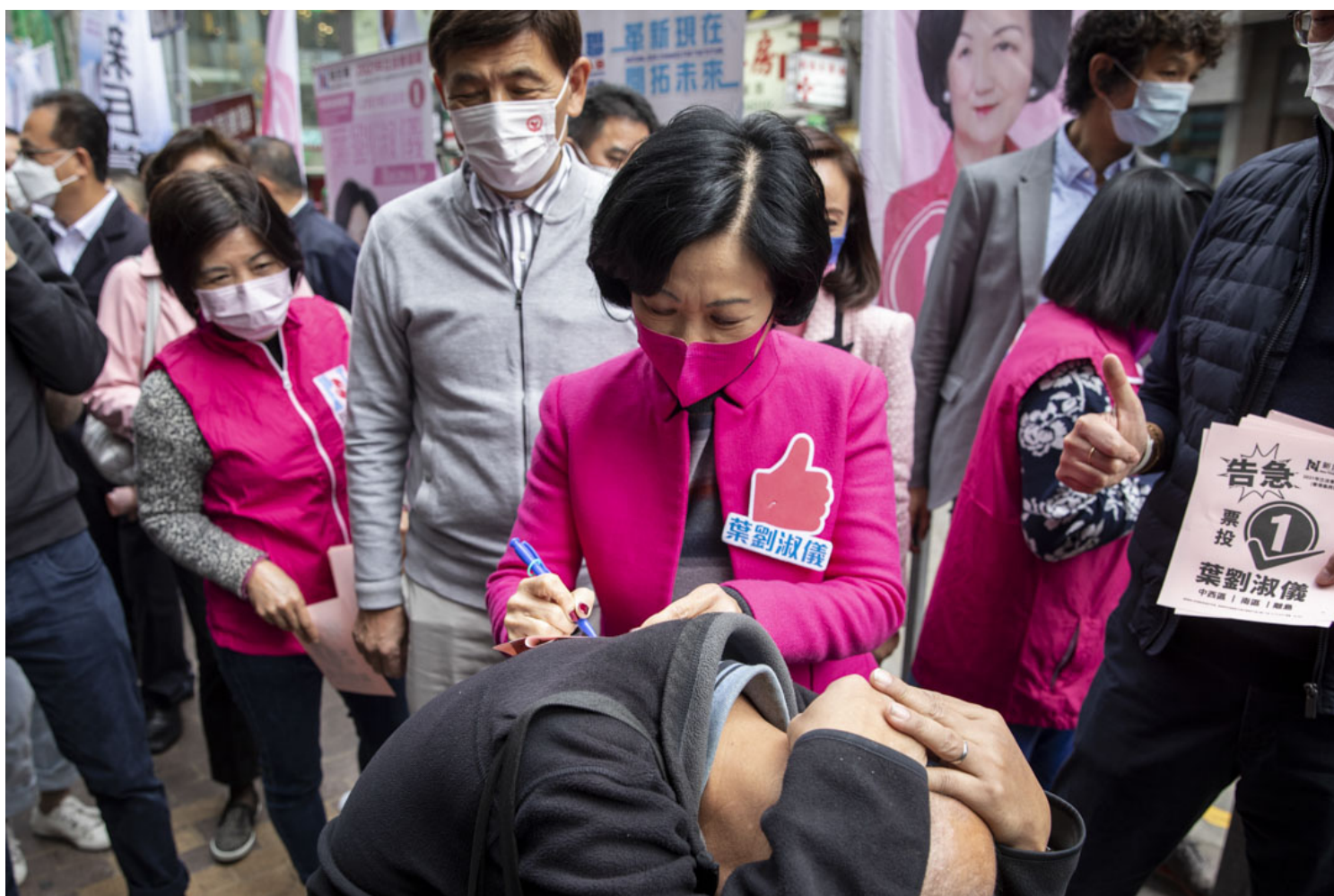
2021年12月19日，港岛西候选人叶刘淑仪在香港仔拉票。

夏女士是九龙东区选民，这是她第一次参加立法会选举投票，她主要通过政府官网了解候选人的资料和政纲，但她形容“这是不够的”。她认为不同的候选人之间仍然是有区别的，比如她注意到一名候选人提到了较多关于女性权益的内容。