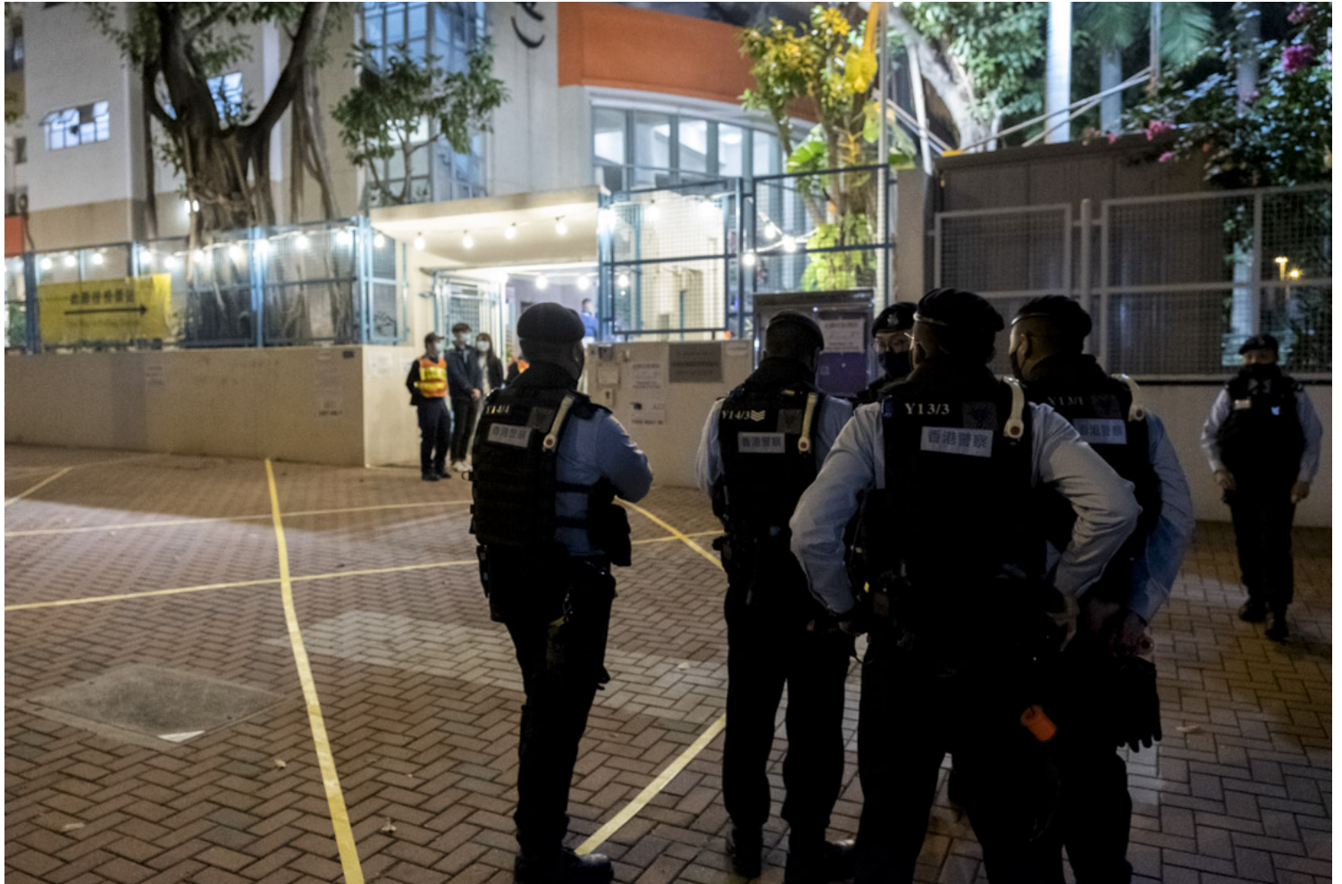
2021年12月19日，九龙西选区，油麻地海泓道油麻地天主教小学票站于晚上10:30分关门，一批警员在票站外戒备。

香港“元善”选举制度后，第一场田全是“爱国者”竞争的立法会选举，进入点票环节。纵使香港政府多日来全力催谷投票，截至19日晚上九时半，地方直选投票率仅29.28%，为九七以后换届选举以来同时段最低。2016立法会选举的投票率为58.28%，2019区议会选举的71.23%。特首林郑月娥于投票结束后表示，有信心新一届立法会，可以切实提升特区管治效能。