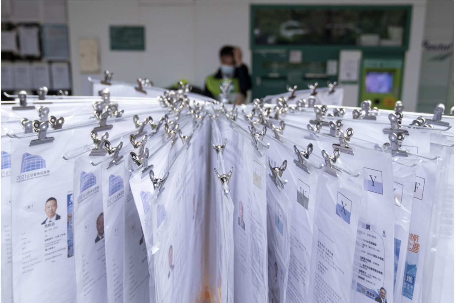
2021年12月19日，港岛东选区，太古城票站外摆放的候选人资料。

个地区的指定地点、巴士和地铁站排队入场，相同情况却不见了踪影。以竹园东投票的上环马善乐小学为例，大批警察于现场驻守，比起那几十名轮候投票的市民更为显眼。至于其他票站，例如新界西北选区的屯门大会堂票站，以及新屯门中心社区中心票站，初期有约20人排队，都迅速被消化。现场可见，排队投票的市民泰半是长者及中年人。