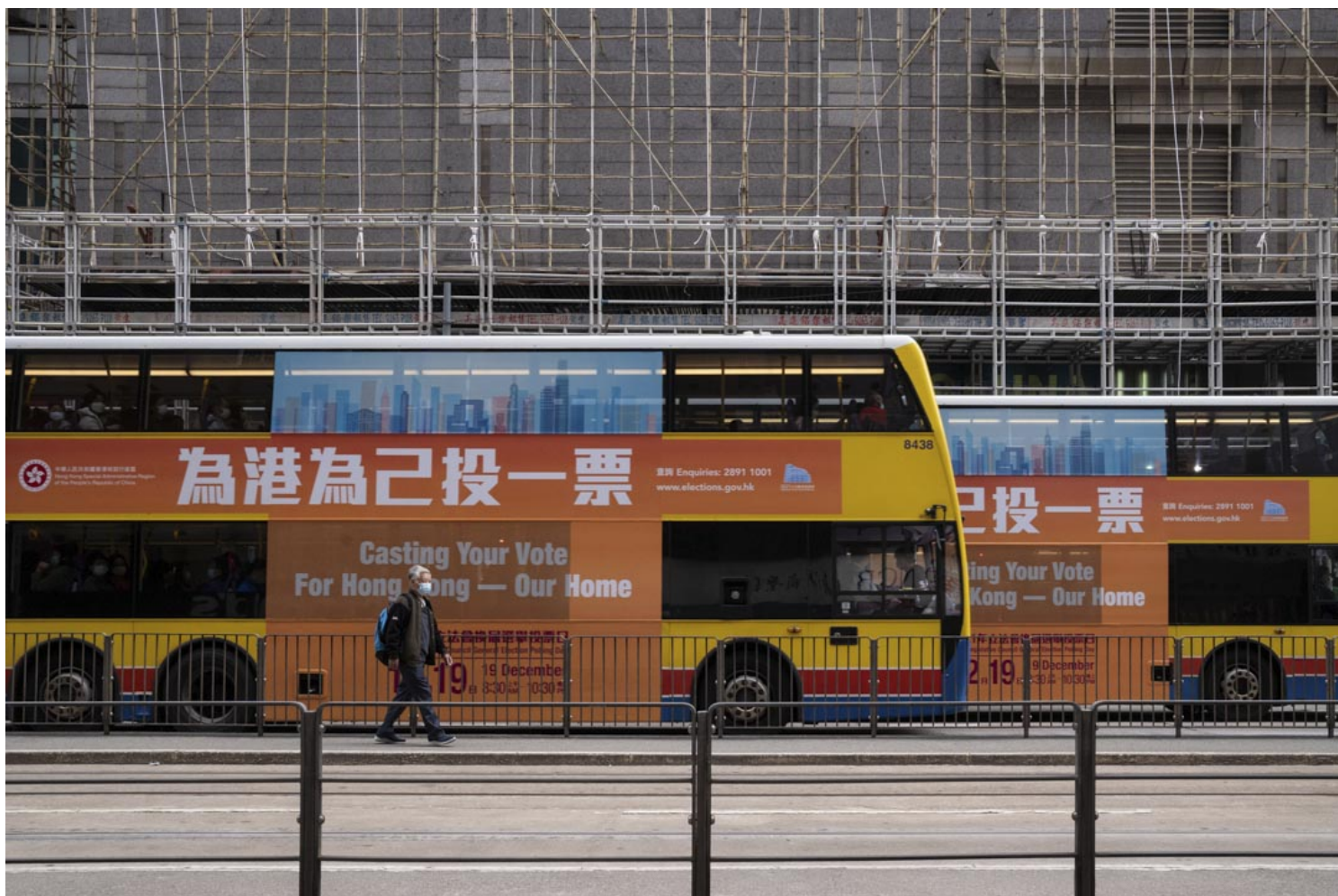
2021年12月19日，北角，巴士车身贴著呼吁市民投票的政府广告。

百万似乎已准备好期望官理。行政长官林郑月娥今早投票后，会见传媒时强调，政府对投票率没有设定目标，又称投票率受很多因素影响，包括政治、社会、经济环境等。全国人大常委会谭耀宗表示，今年无法与2019年区议会选举的特殊情况作比较。全国政协委员唐英年亦指，不要盲目追求高投票率，认为即使投票率高，都未必选到最好的议员。