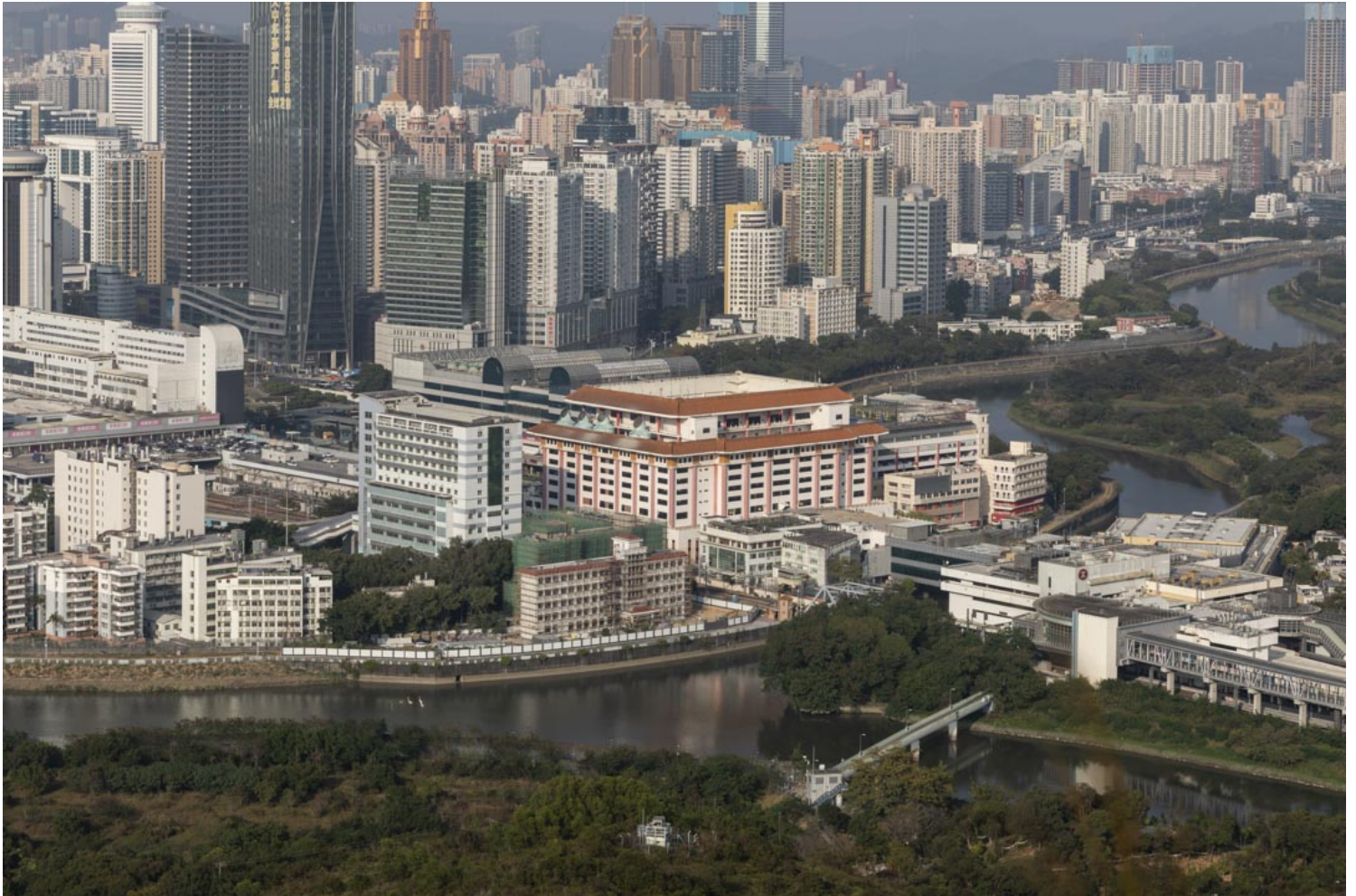
今年政府首次于边境设立三个投票站，分别位于莲塘香园围、罗湖及落马洲福田口岸。图为罗湖口岸。

不过，端传媒记者于现场观察，不少票站只有一位，甚至没有警员站岗。部分票站如香港岛西选区的海怡社区中心、新界东南选区的康城社区会堂等，外面则有数名军装警，以及戴有专用臂章的特务警察驻守。