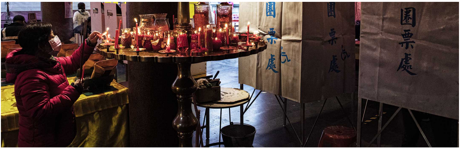
2021年12月18日板桥，市民在庙内投票所附近拜祭。