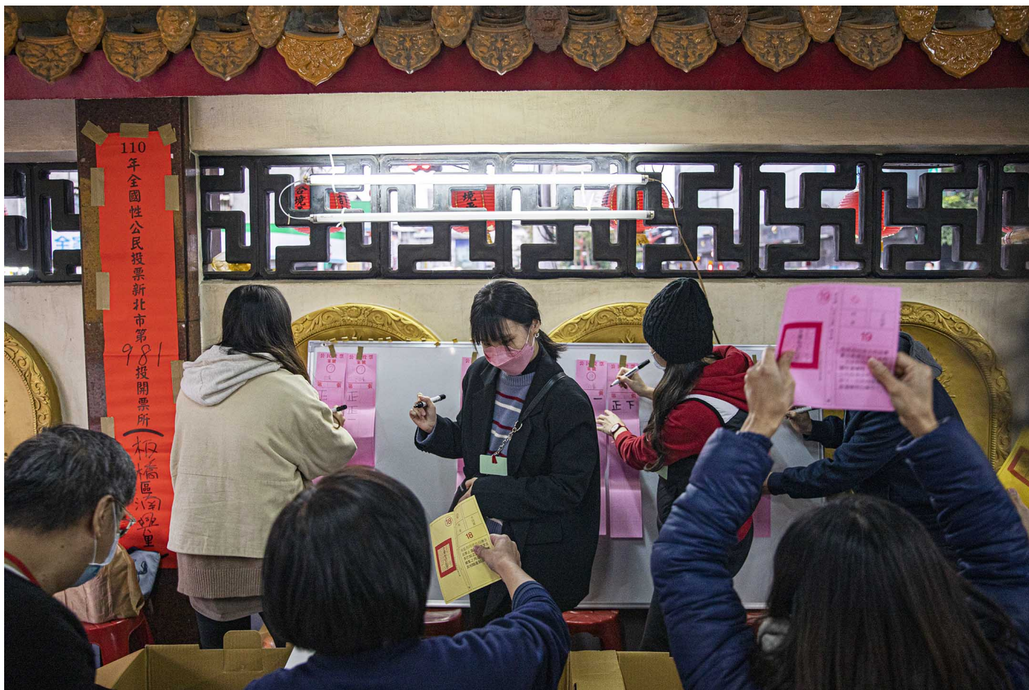
2021年12月18日板桥，投票所内正在唱票。

朱立伦同时对于“台湾公投已死”感到非常遗憾，并批评民进党政府依靠行政资源，再次战胜了人民、碾压民意。他认为民进党修法拉高了门槛，又刻意压低投票率，不只“让台湾公投走到尽头”，也将让台湾走进“民主独裁”，并称“国民党会坚定地站在民众这边”，再接再厉。