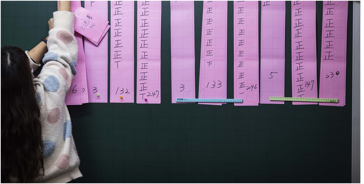
2021年12月18日板桥，投票所内正在唱票。