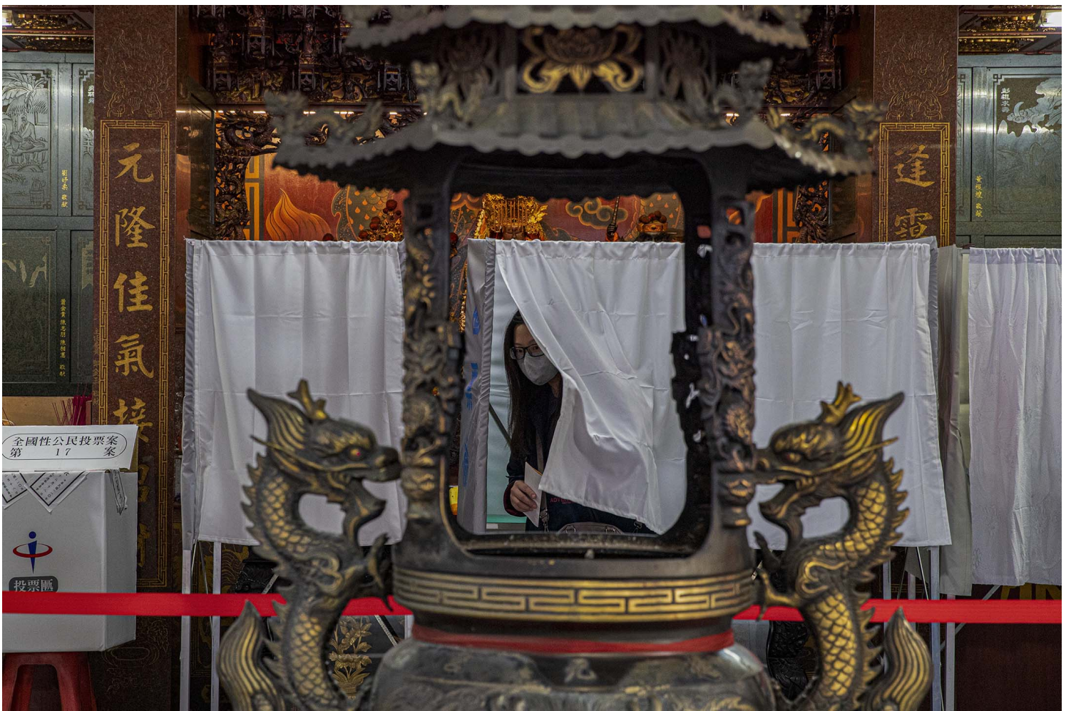
2021年12月18日板桥，市民在庙内投票。