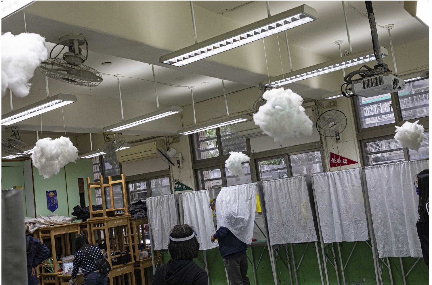
2021年12月18日台北，市民在一所学校内投票。

尽管选前民调一般认为，此次公投结果对执政的民进党政府不利，很可能如国民党所望，四个公投案全数同意过关，或者至少也有“三同意一不同意”的佳绩；然而公投结果却是四案全数不过关，不只令不少人讶异，也被视为国民党的一次挫败。