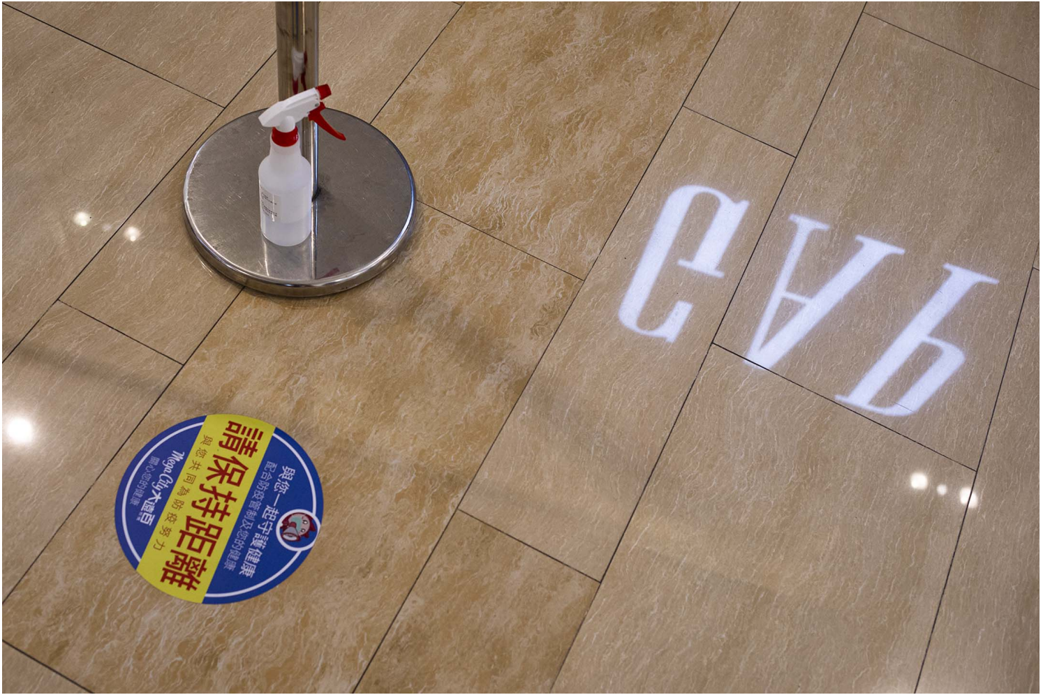
2021年12月11日板桥大远百，商场内接种疫苗的地点。