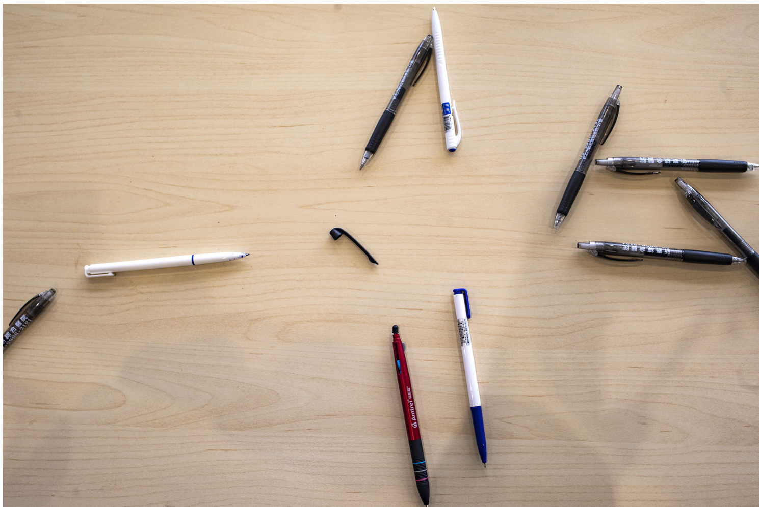
2021年12月7日新庄宜家家居，一张桌子上放满市民填写表格的笔。