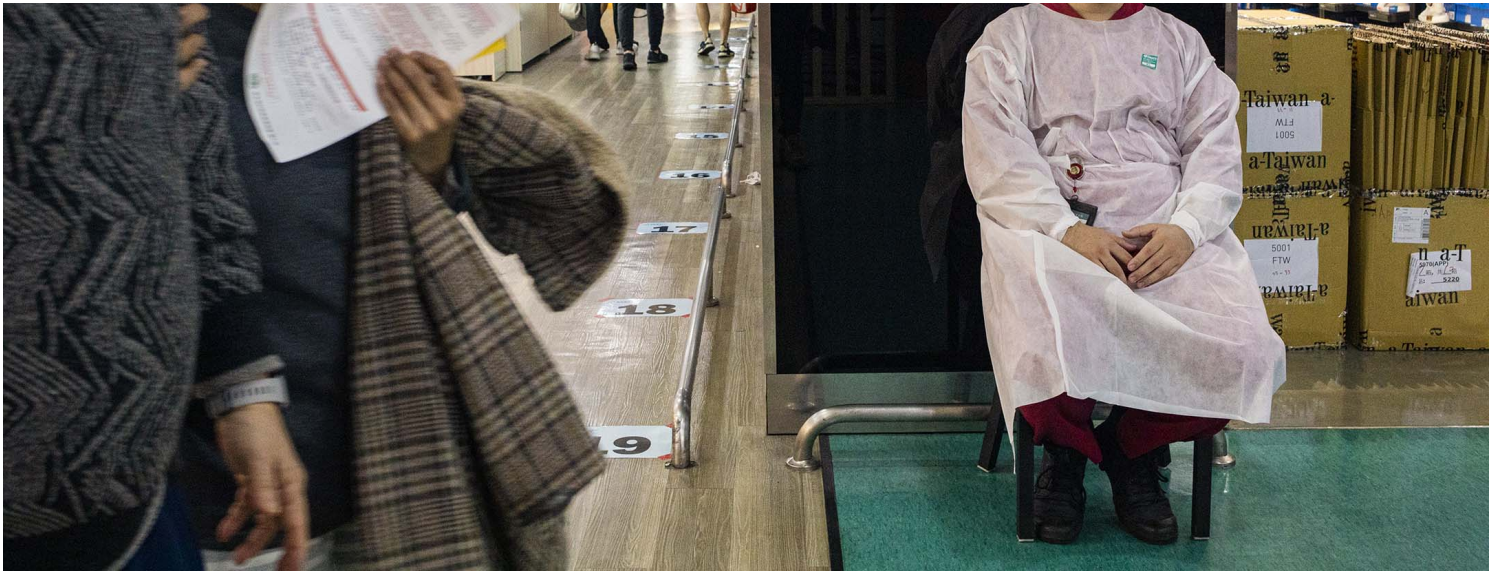
2021年12月10日新店家福乐，医护人员在接种疫苗处工作。