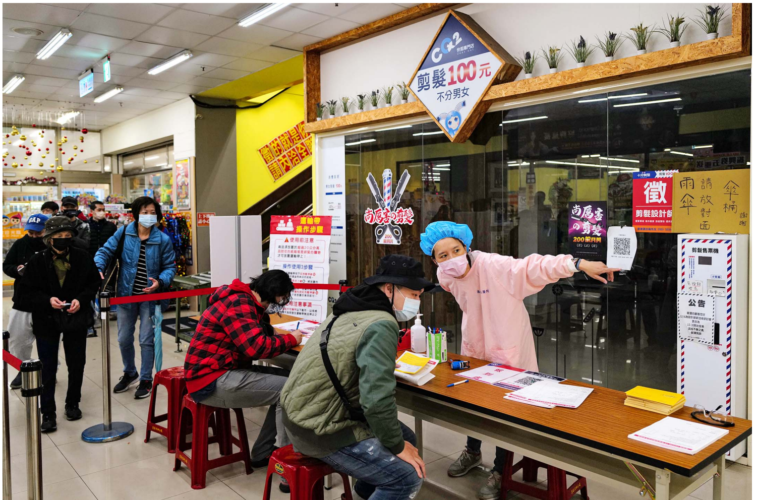
2021年12月6日板桥全联超市，工作人员指示市民接种疫苗的地方。

所幸，台湾在两个月的时间之内，便走出近乎封城的疫情巅峰，人们的日常生活逐渐恢复正常，疫苗抢打潮也淡去。