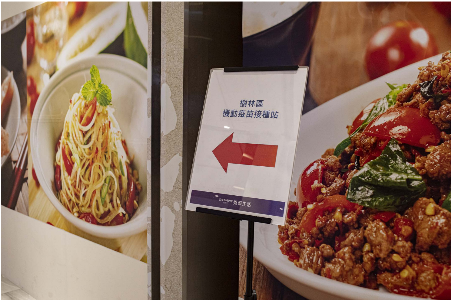
2021年12月11日树林秀泰生活，商场内一个牌子指示接种疫苗的地点。