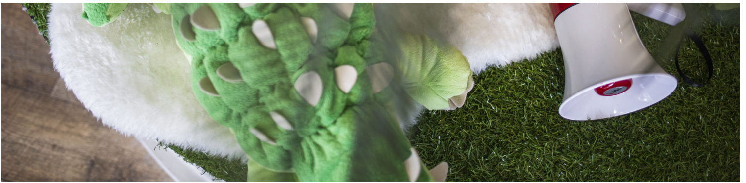
2021年12月7日新庄宜家家居，一个喇叭用来播放施打疫苗的安排。