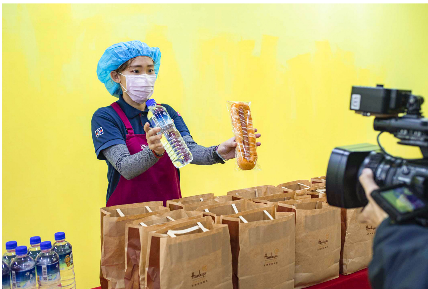
2021年12月6日板桥全联超市，工作人员展示施打疫苗后的赠品。

目前疫情指挥中心已将相关人员隔离、检测，并要求中研院提出检讨报告。然而确诊者足迹曾出现在台北市、新北市等人潮众多的公共场所，是否带来潜在社区传播力，仍有待观察。