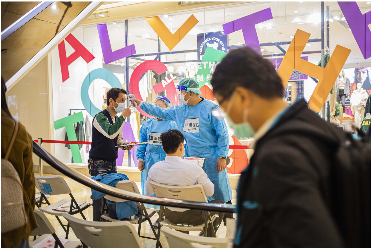
2021年12月10日板桥大远百，市民在商场内等候接种疫苗。