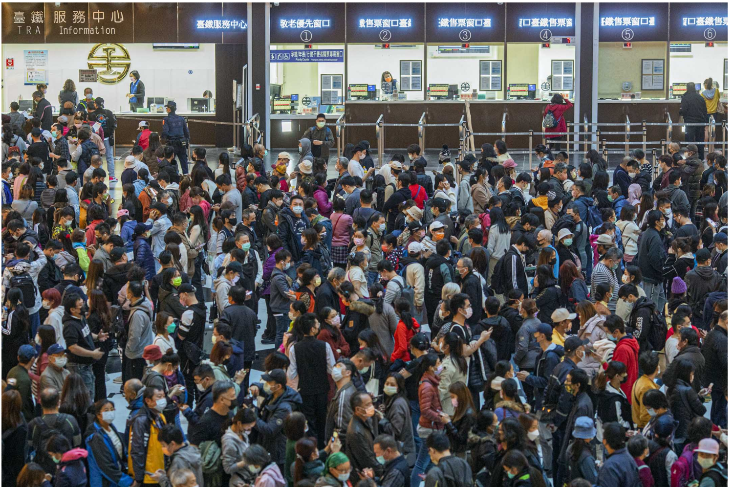
2021年12月7日台北车站，大批市民在排队等候接种疫苗。