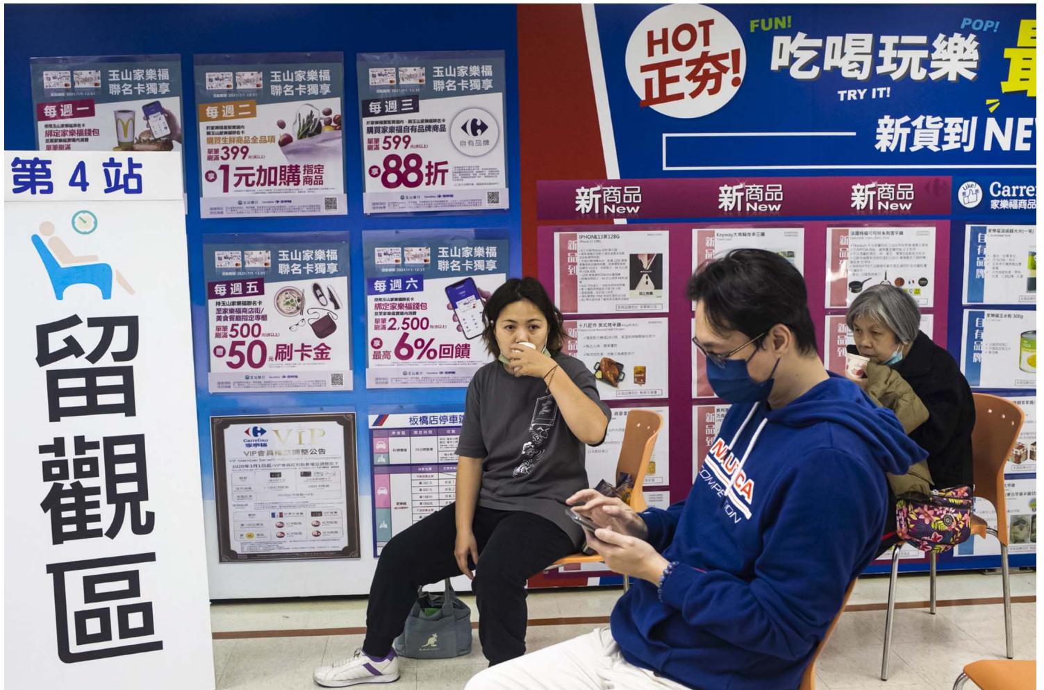
2021年12月9日板桥家乐福，市民接种疫苗后在留观区喝茶休息。