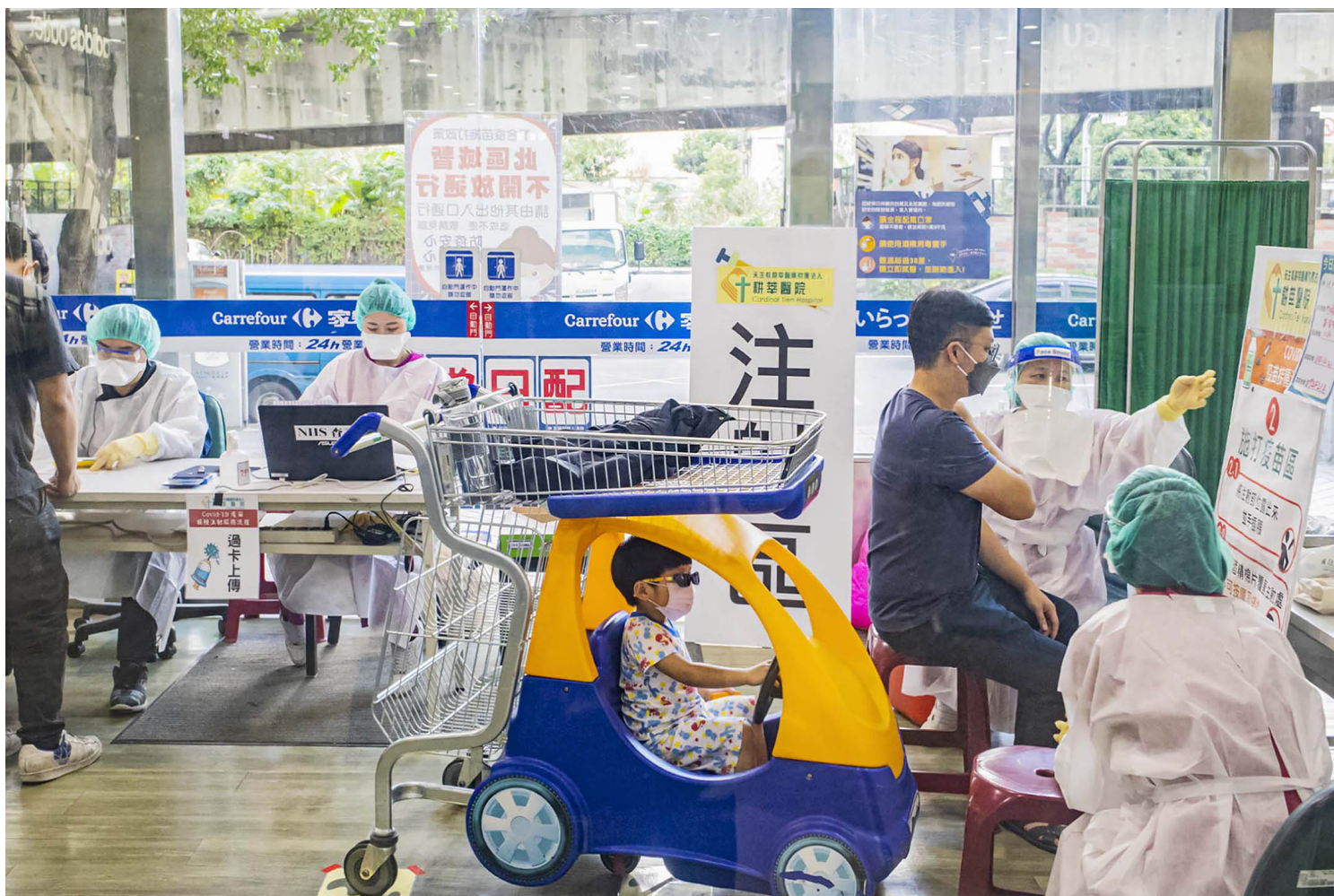
2021年12月10日新店，市民在家福乐排队接种疫苗。

为了刺激打气，台湾政府近日开始在车站、卖场、政府大楼等公共场所设立机动接种站，并祭出“打疫苗送礼券”的措施。