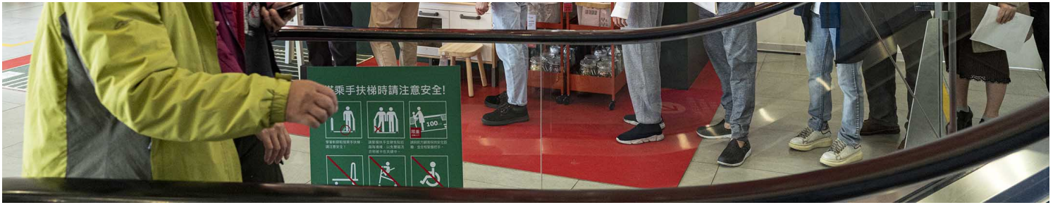
2021年12月7日新庄宜家家居，市民等待接种疫苗。