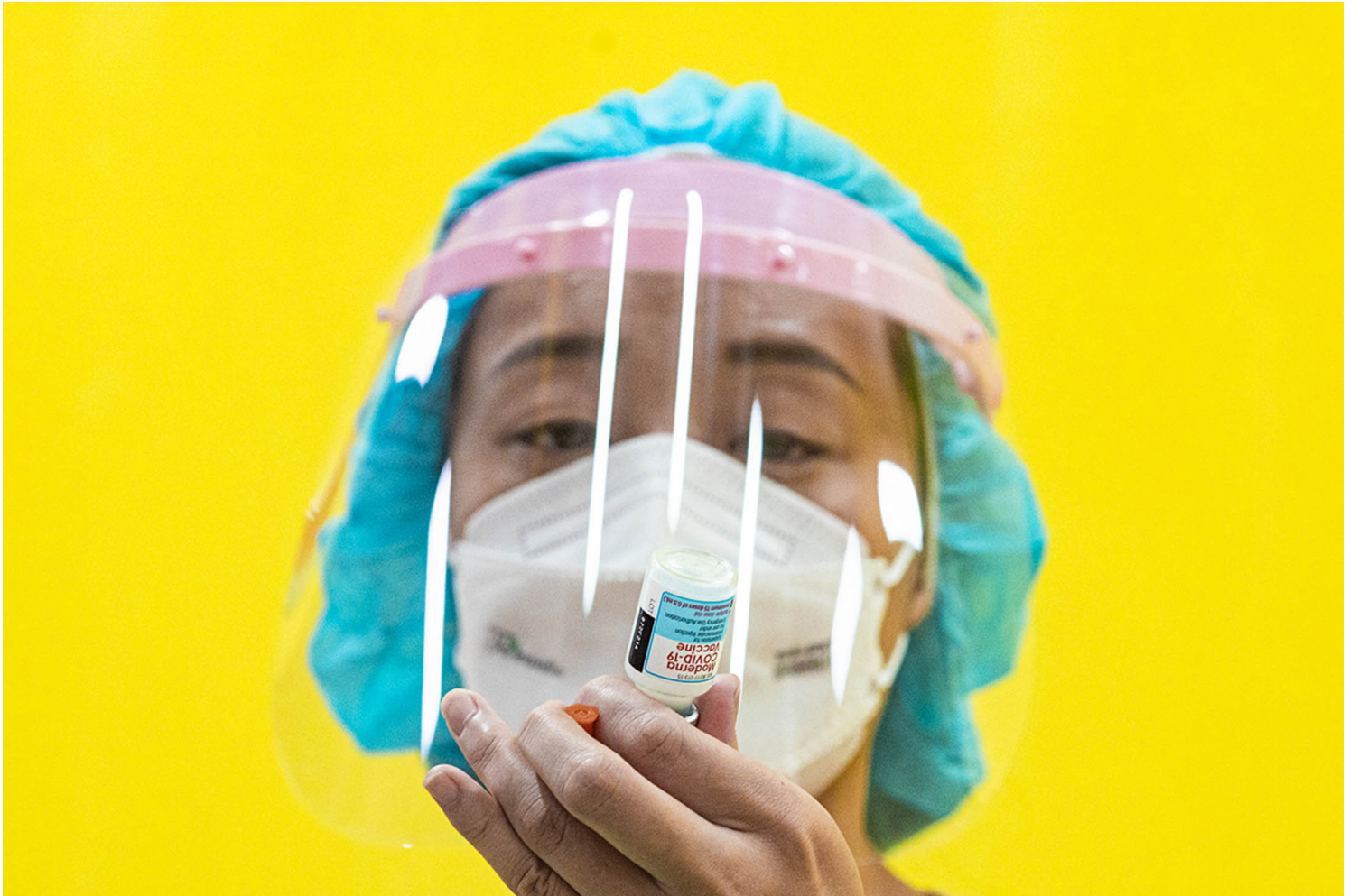
2021年12月6日板桥全联超市，医护人员预备施打疫苗。