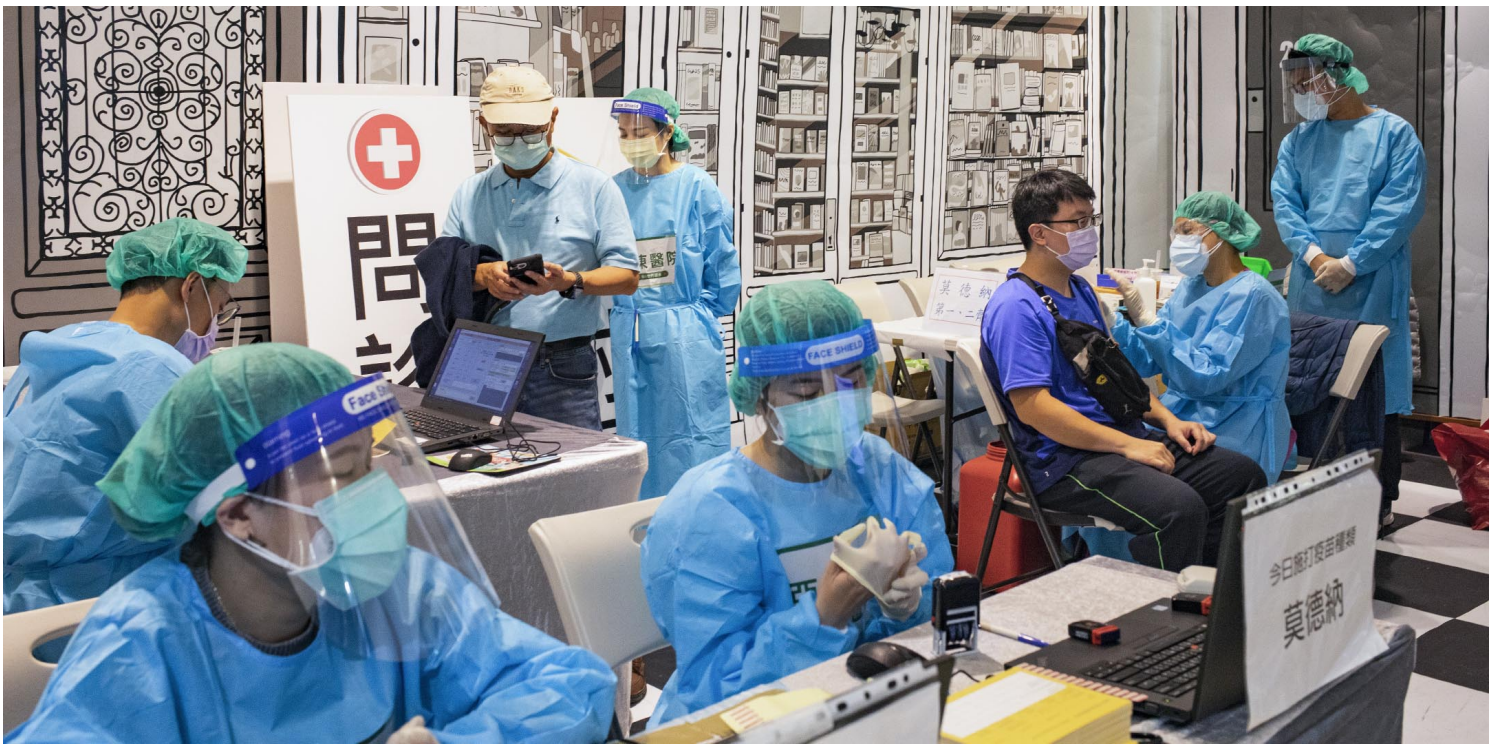
2021年12月10日板桥大远百，市民在商场内接种疫苗。