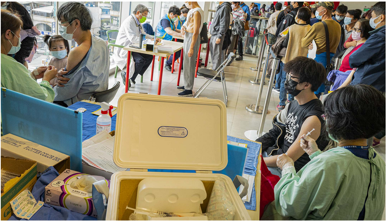
2021年12月7日新庄宜家家居，市民在接种疫苗。