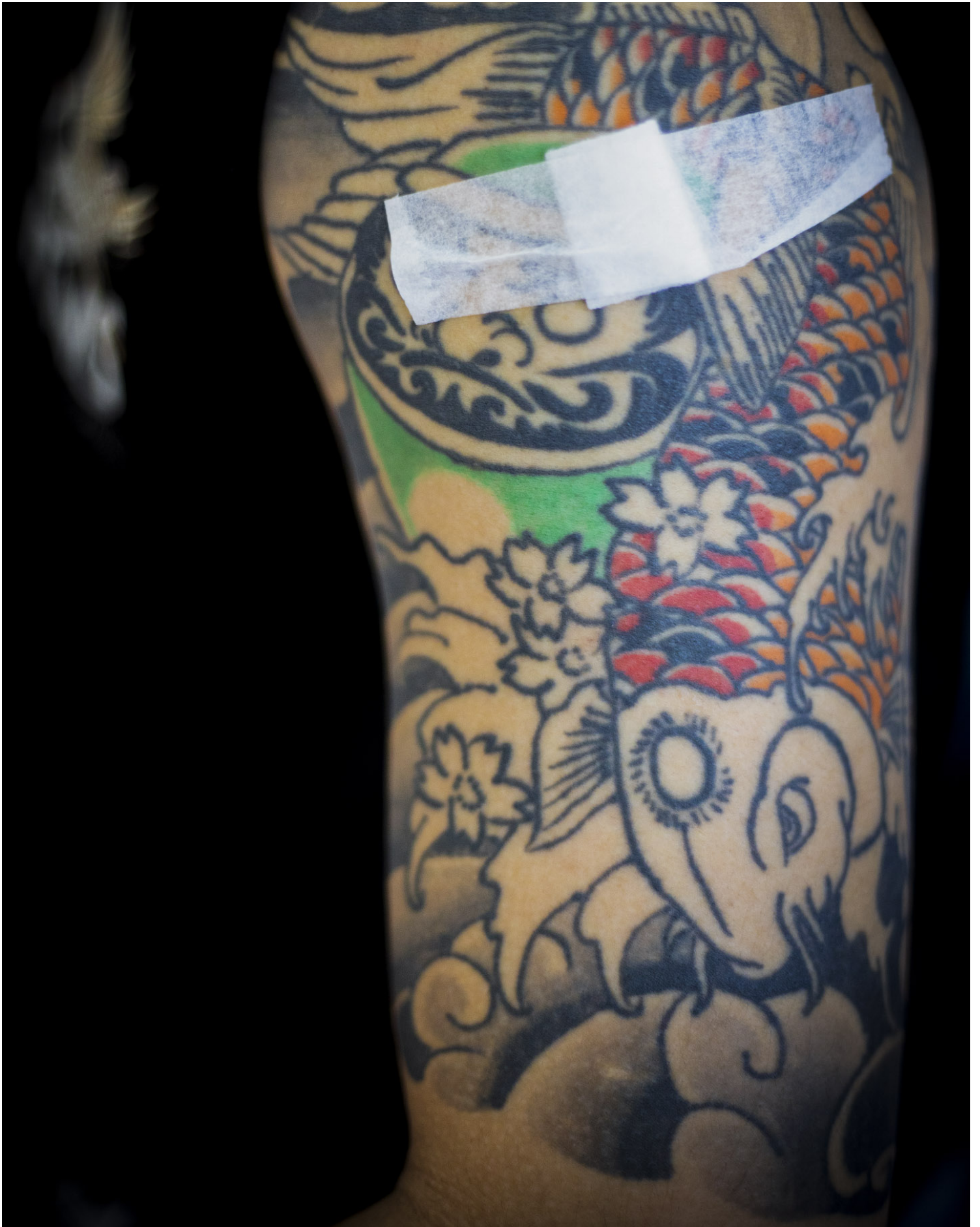
2021年12月10日新店家福乐，一名市民在接种疫苗后休息。