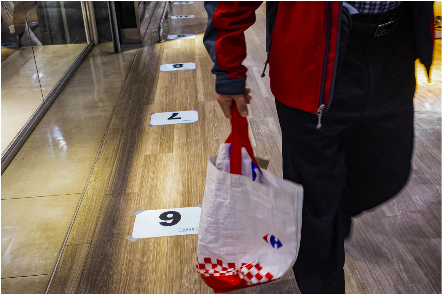
2021年12月10日新店家福乐，商场的地上贴上排队打疫苗的标示。