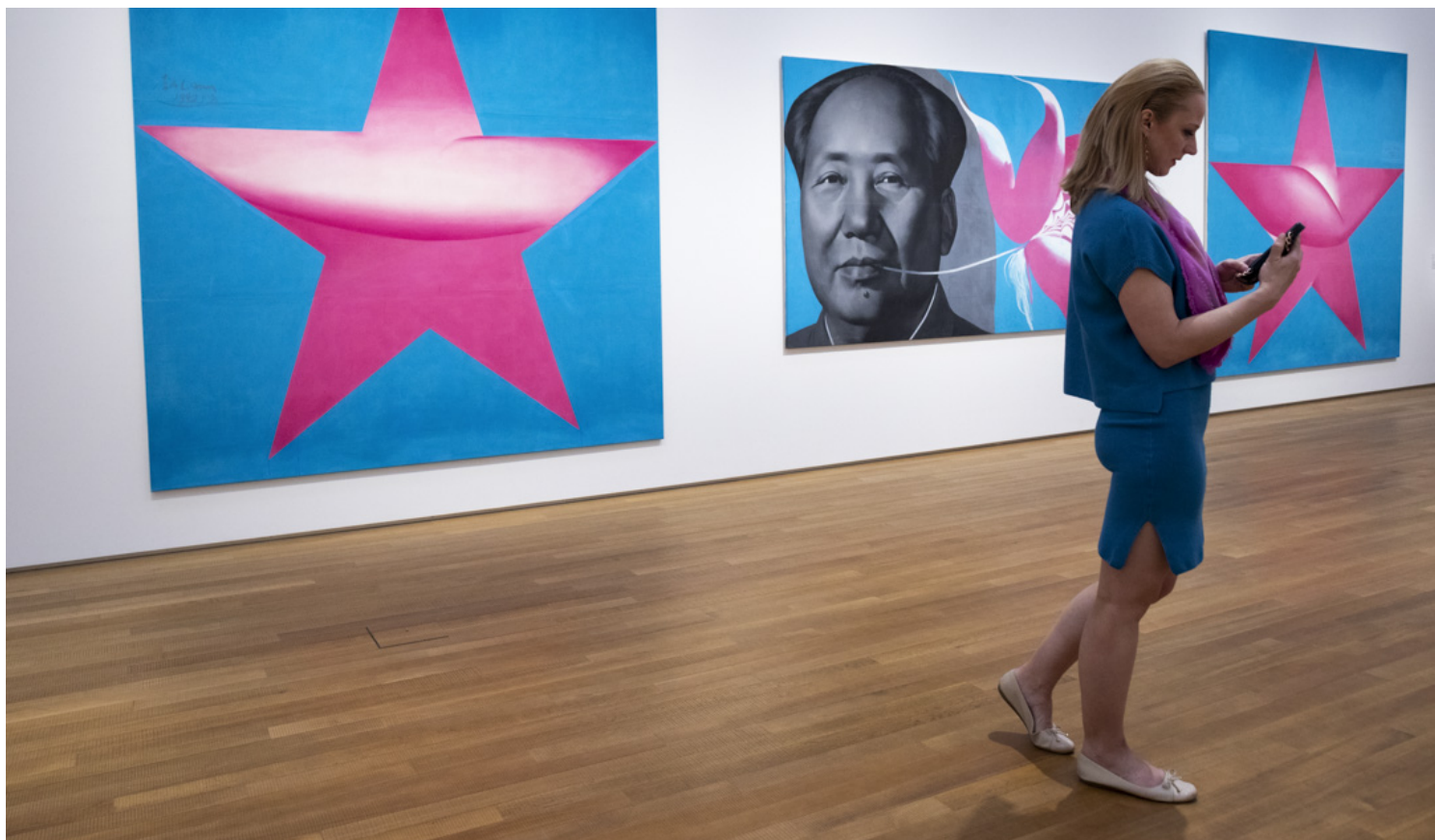
李山的《胭脂》系列作品。