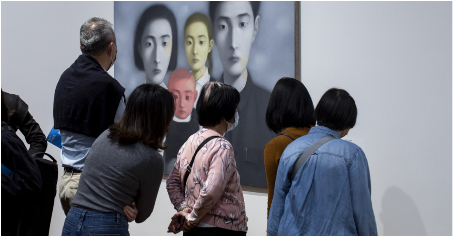
张晓刚的《血缘-大家庭17号》。