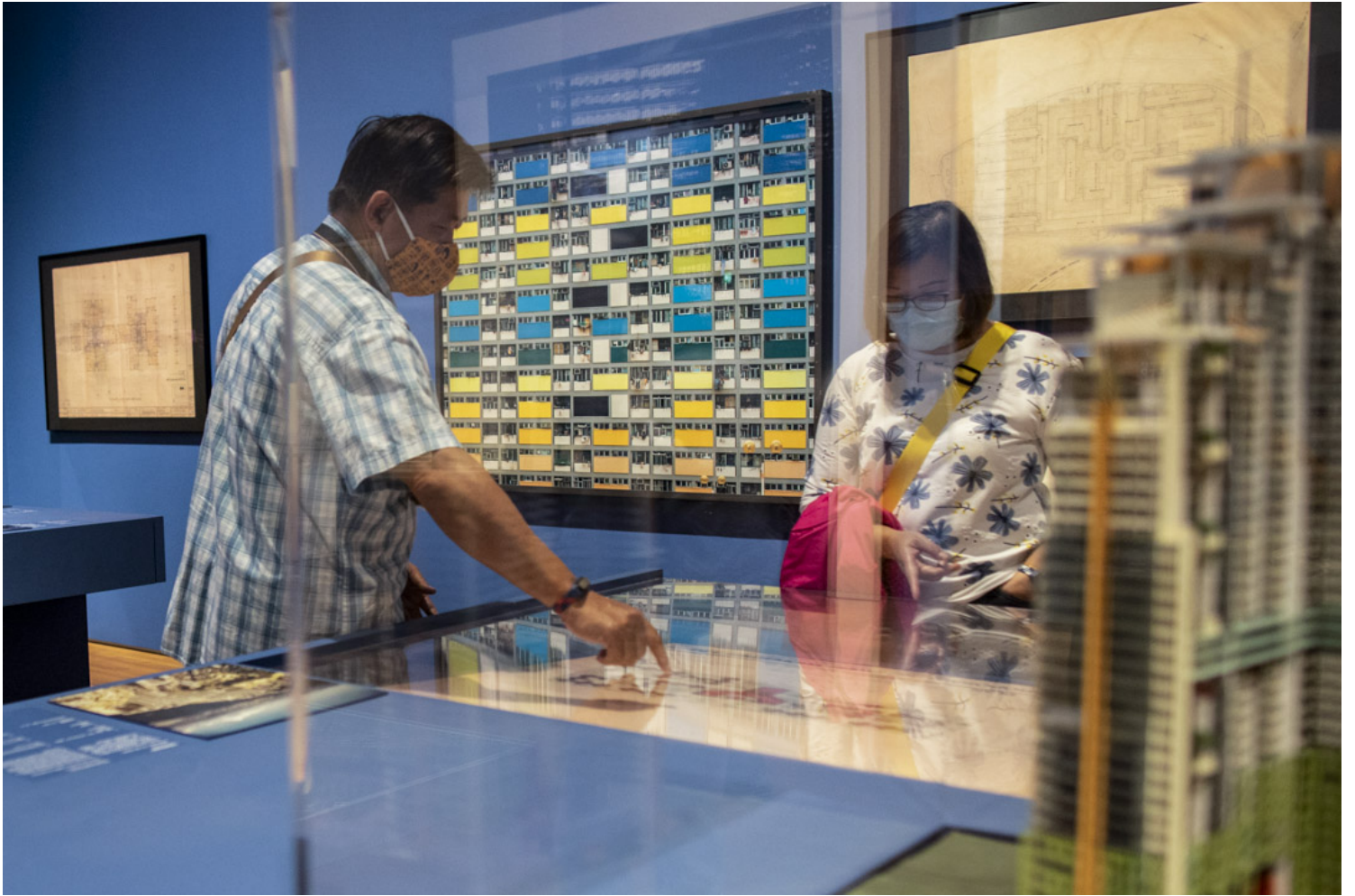
Michael Wolf 的摄影作品《彩虹邨》。