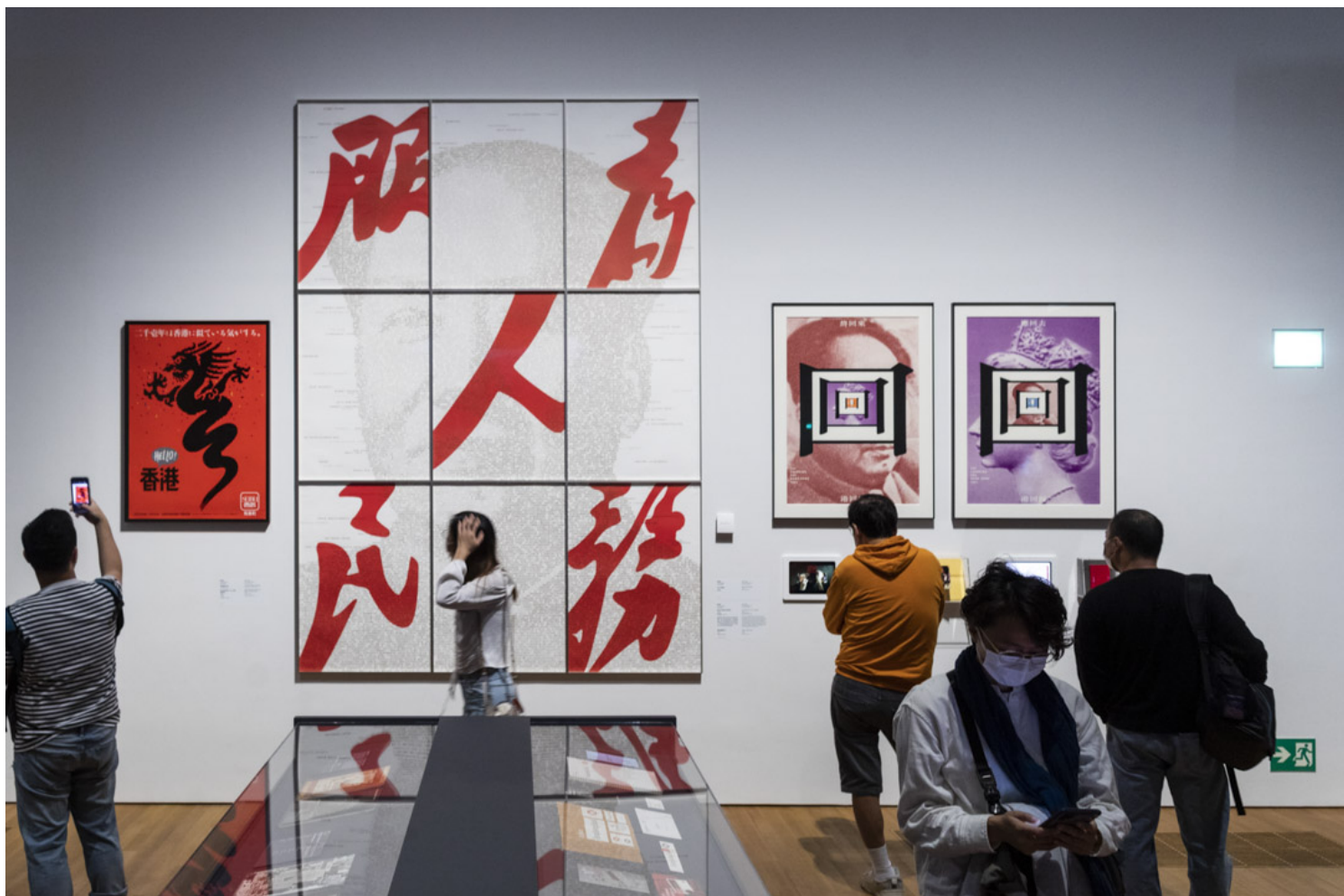
陈幼坚的《为人民服务》海报系列。