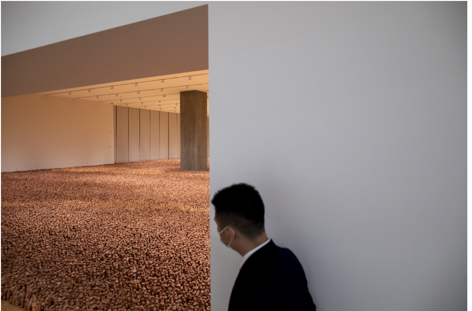
英国知名雕塑家Antony Gormley的作品《亚洲土地》，内容是邀请广东象山村村民人手制作的小泥偶，做成一片如海的泥人黏土大作。这装置属于Antony Gormley的《土地》系列之一，整个系列的创作历程始于1989年，艺术家先后于澳大利亚、南北美洲、欧洲和英国等地制作不同版本。