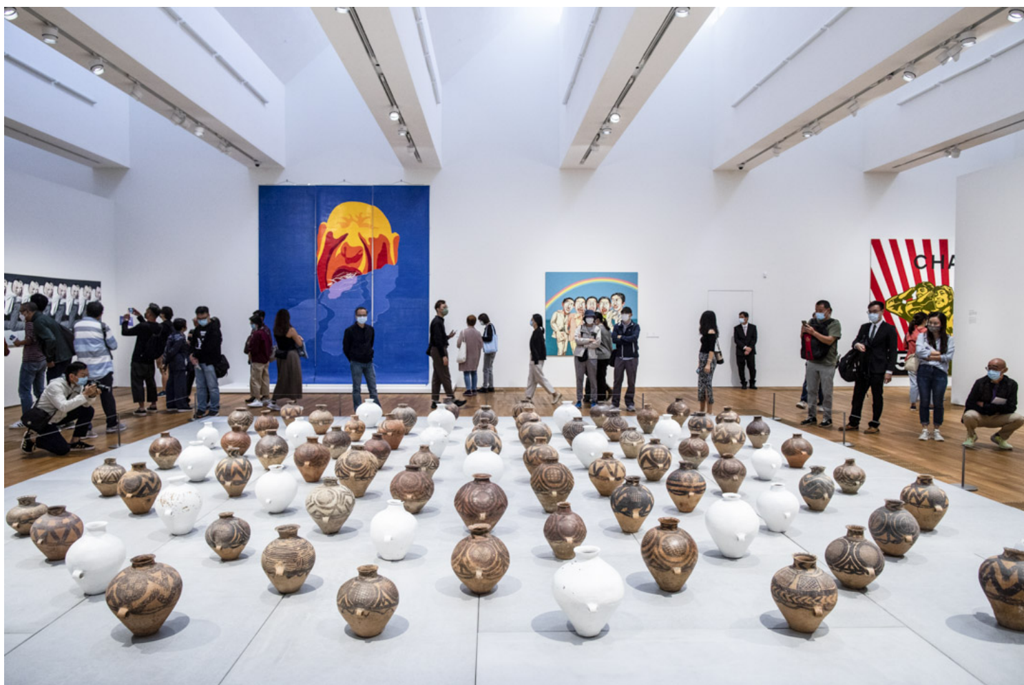
中国异见艺术家艾未未知名的陶罐装置《洗白》。

建制派特别点名其中一项希克藏品——艺术家艾未未的系列作品《透视研究》，作品纪录艾未未在北京天安门广场、香港维多利亚港、巴黎艾菲尔铁塔和美国白宫前举起中指。希克藏品是前瑞士前驻华大使、收藏家Uli Sigg于2012年以半捐半卖形式交予M+的，包括1500件艺术品，是M+的明星馆藏。