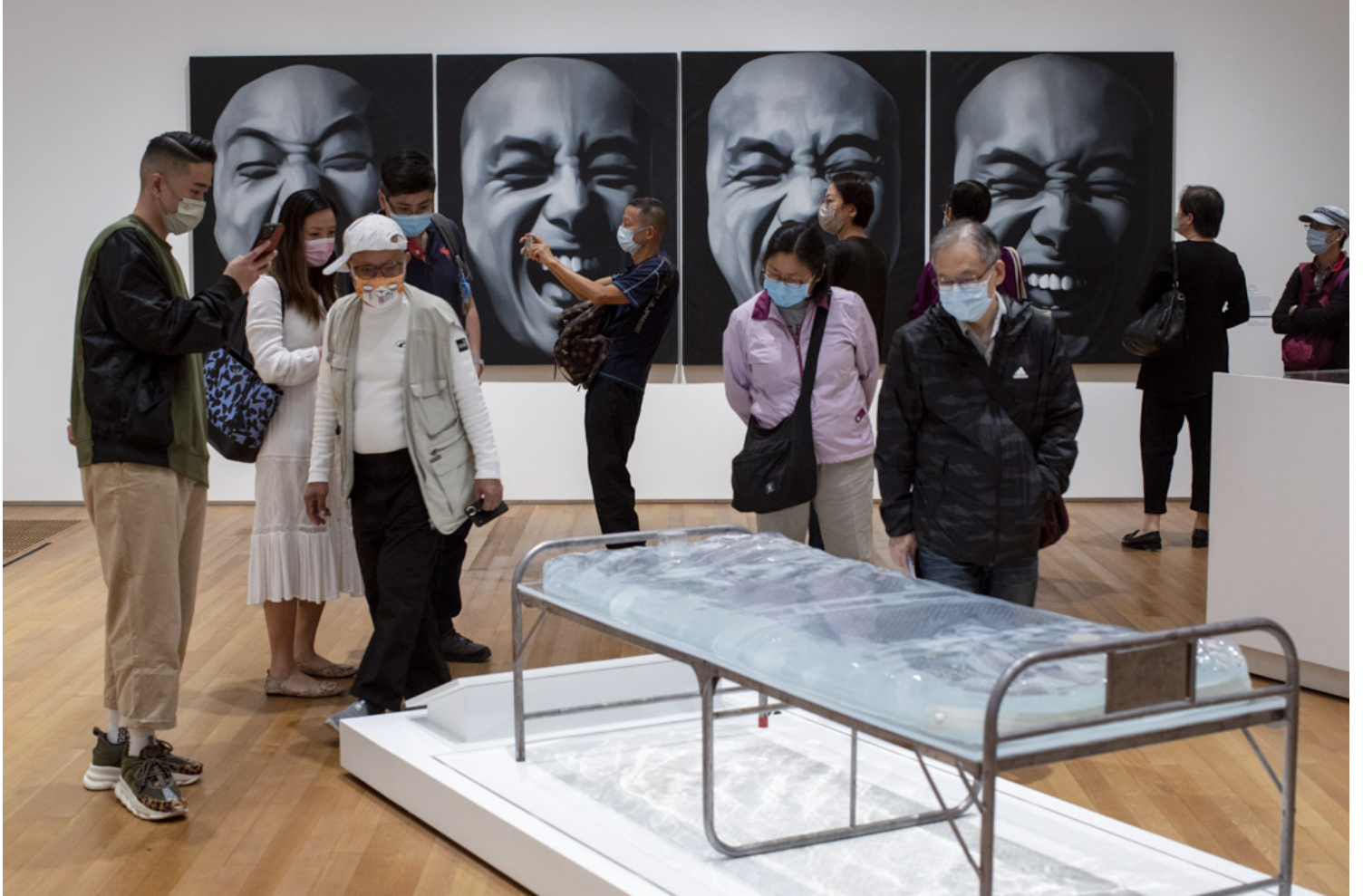
耿建翌一组四幅单色油画《第二状态》。