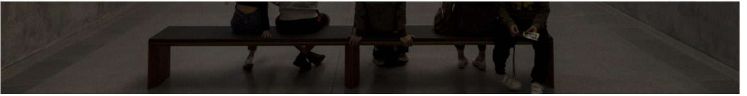
张英海重工业《被钉十字架的电视机 - 天堂也不听的祷告》。