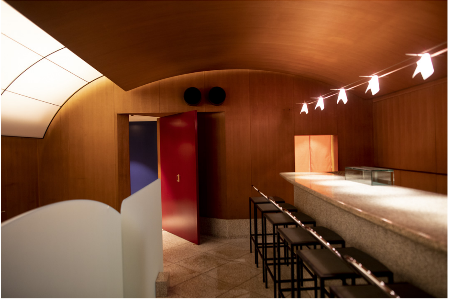
曾被质疑以1500万元“巨额”购置的《清友寿司吧》，是日本设计师仓俣史朗的作品。