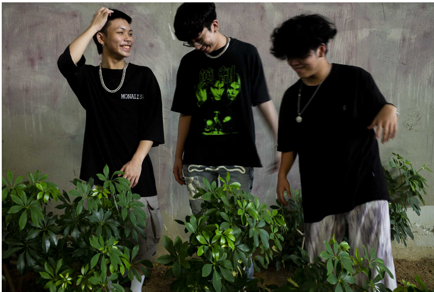
子熙、Ricky与哈比。