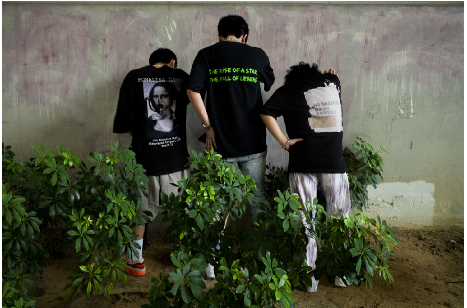
子熙、Ricky与哈比。

在香港 Hip Hop 界，太“Real”的尽头可能是“Fake”。有些 Rapper 在社会运动期间发布了有关政治内容的歌曲，网上点击率逾二百万，有人认为在这个时代发布政治歌曲是消费政治，Jason 难忘许多网友的评价：“（有些人说）『这个时候出这些歌，是否想趁机红？借新闻热度？』”在这个时代，发表什么内容、如何发表也成为一种学问。