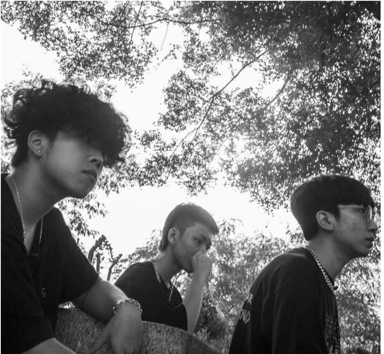
哈比、子熙与Ricky。