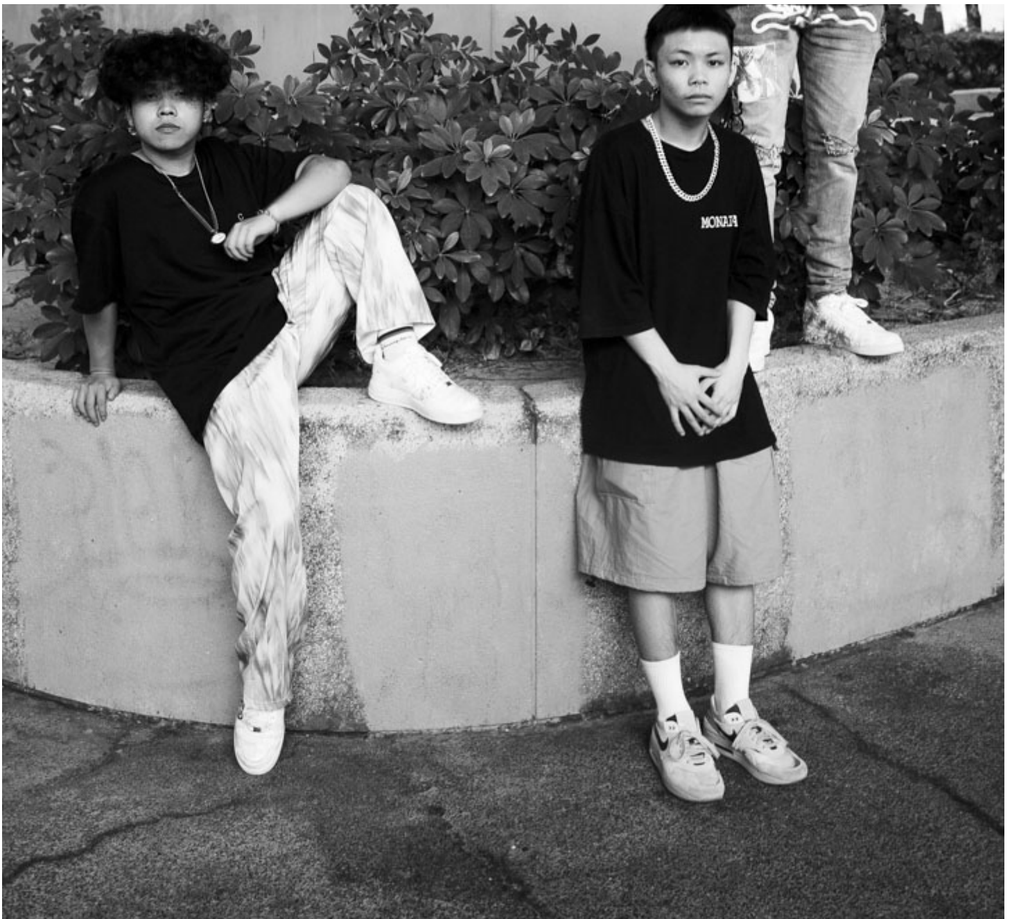
哈比、子熙与Ricky。