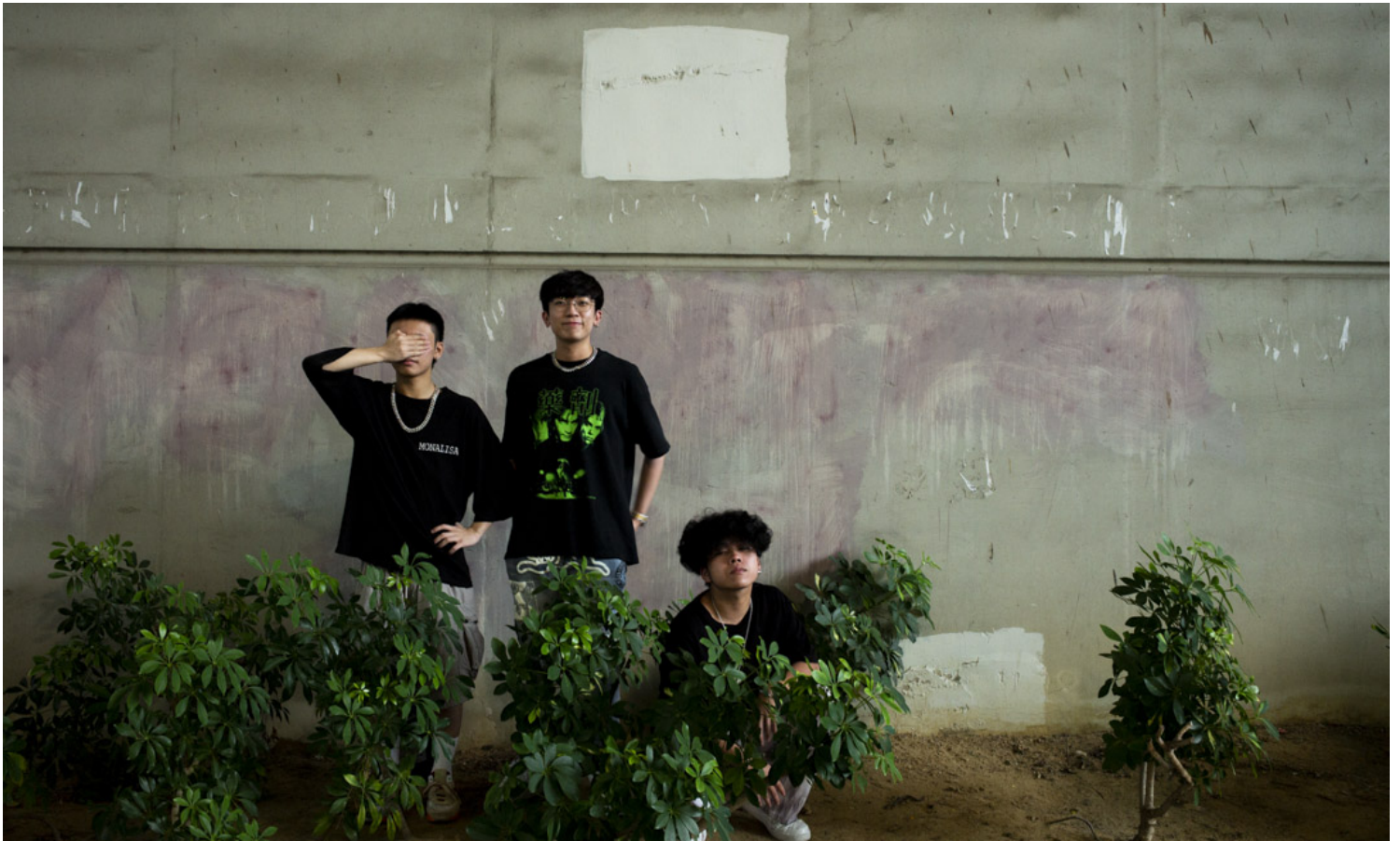
子熙、Ricky与哈比。