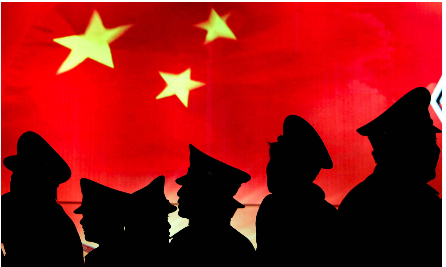
2008年3月1日北京，中国人民革命军事博物馆，保安走过中国国旗。