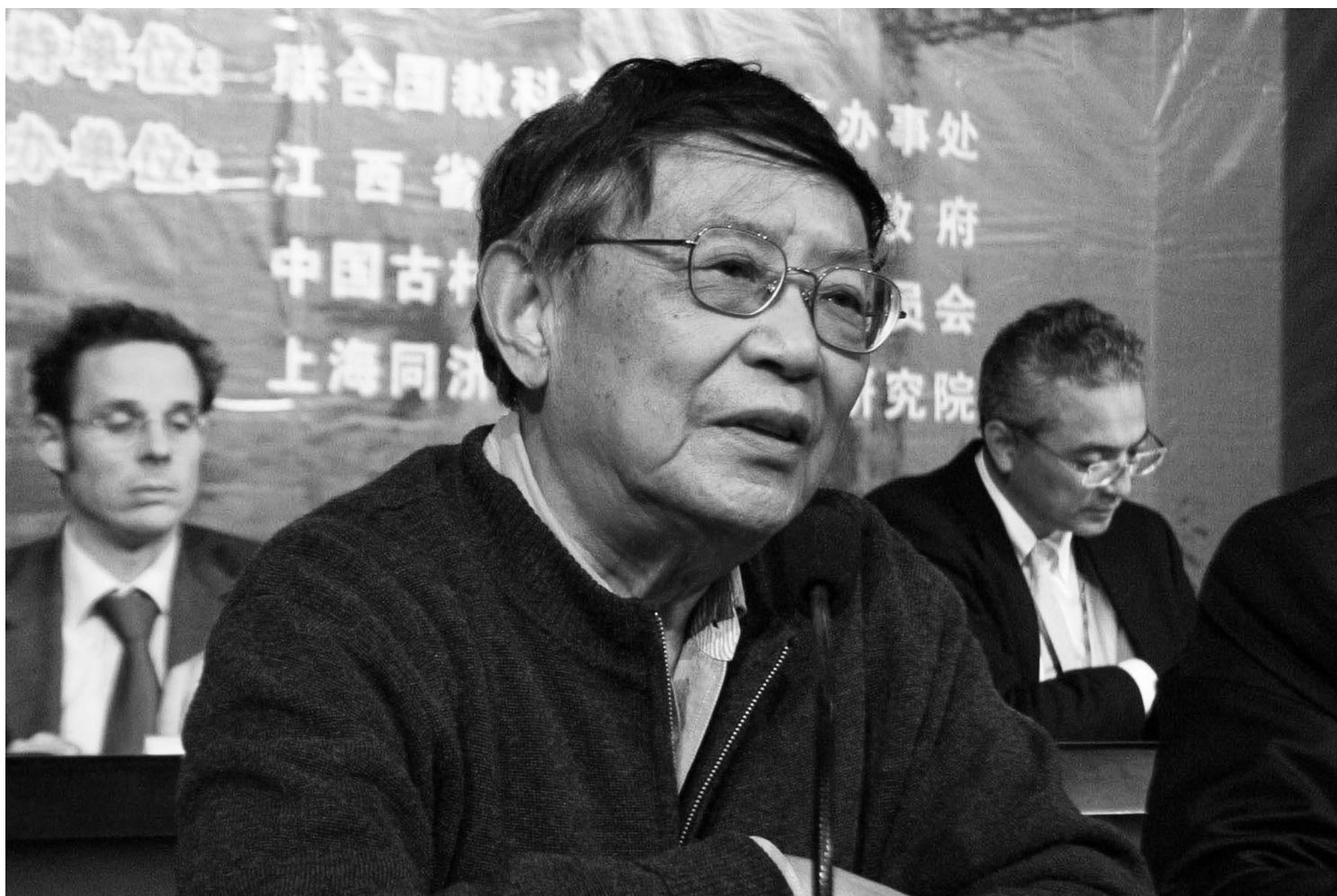
2006年11月11日中国江西省上饶，中国哲学和美学学者李泽厚于婺源县旧村保护和新农村建设论坛上发表讲话。

改革开放后，在特殊的政治文化环境中，美学意料之外、情理之中地成为了知识分子和青年学生谋求思想解放的突破口，李泽厚的“美学三书”先后出版，主编的一系列美学丛书和《美学》期刊也大获成功。同时，《中国近代思想史论》《中国古代思想史论》和《中国现代思想史论》完成，显示出他的兴趣从哲学向历史学的过渡（冯友兰曾戏谑地化用曾国藩名句，说他是“刚日读经，柔日读史”）。这一变化既是因为他认为审美和文化是层累的历史“积淀”；也是因为他受到文化热中“传统文化何处去”议题的影响；更和对早年经历的反思、对当下政治的关切有关。