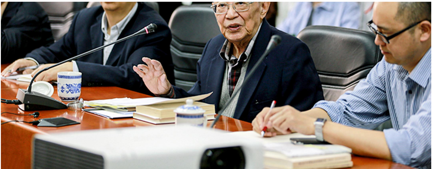
李泽厚于华东师范大学演讲。