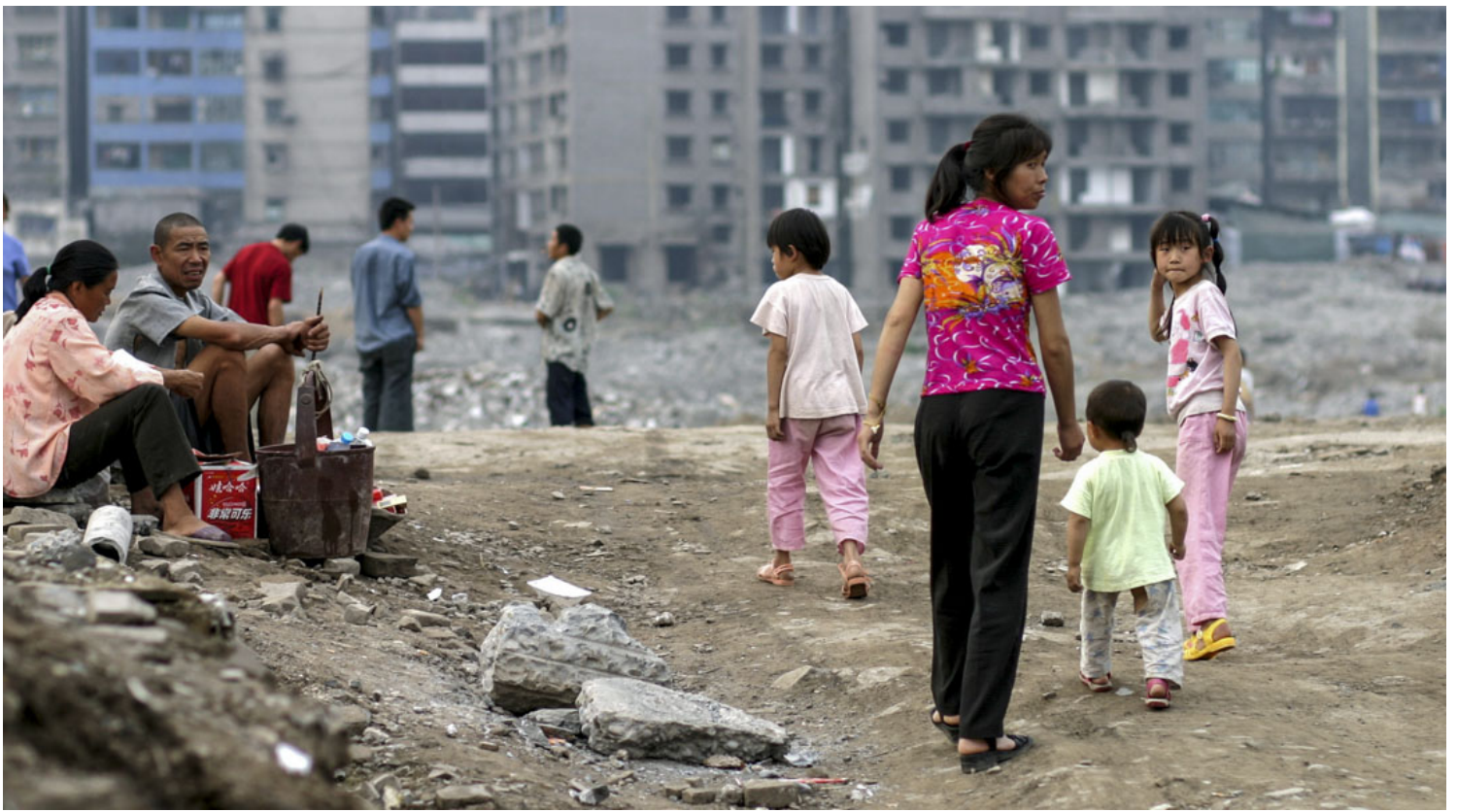
2003年6月6日，湖北，長江旁邊的奉節鎮的居民。

何伟的《江城》，以一位美国人的视角来描写90年代长江沿岸的城市涪陵人民生活，一些生活中的细节，也体现了中美两国在社会和文化等方面的差异，处在转型期的中国，普通人的精神状态怎么样，在那本书中体现得淋漓尽致。