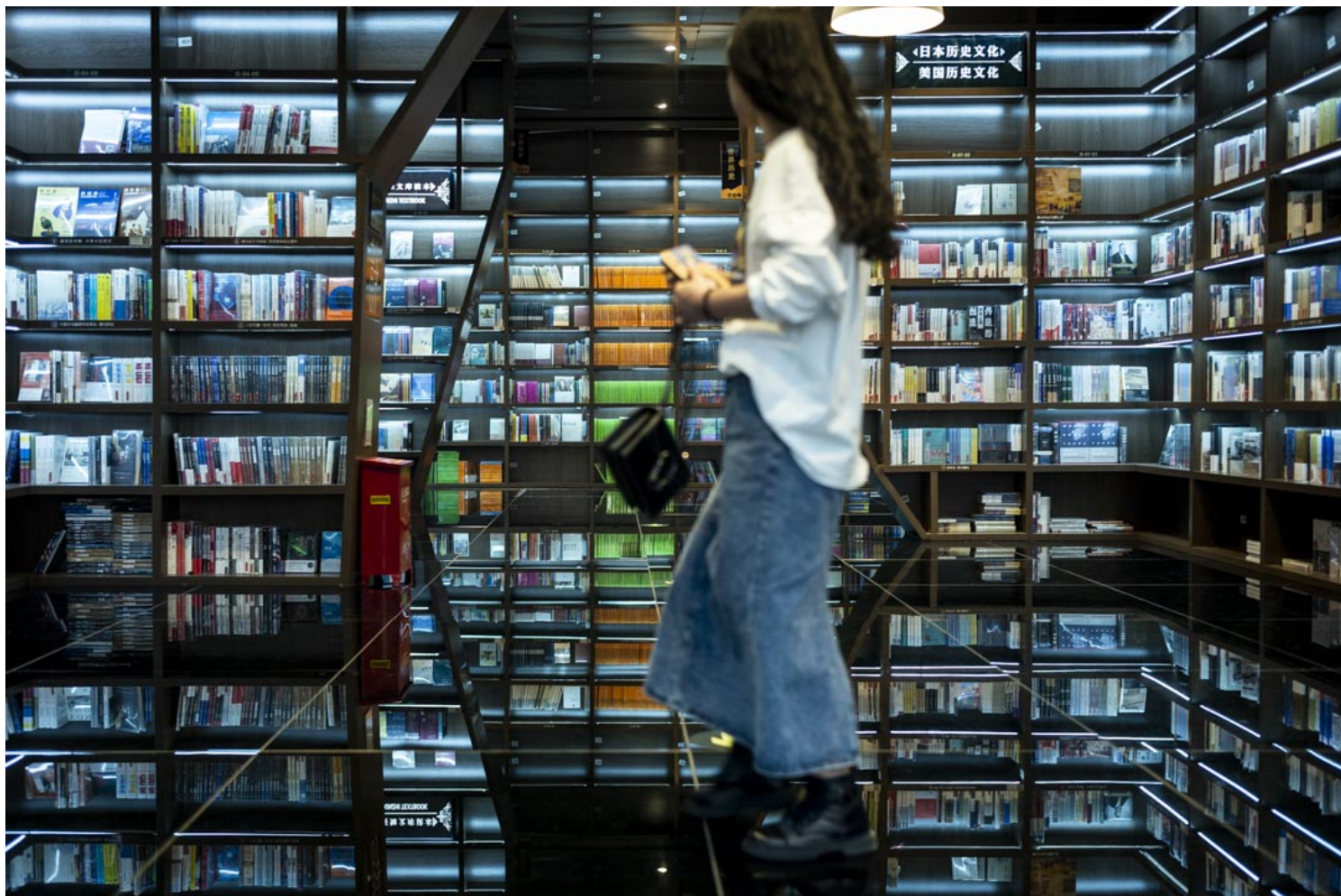
2021年5月30日，贵阳一间书店，女士在店内选书。

读这本书的时候，相较于对自然万物更恭谨谦卑的俗套，我感到更强烈的是一种“人活一辈子，一边徒劳，却又一边作恶”的无力感。