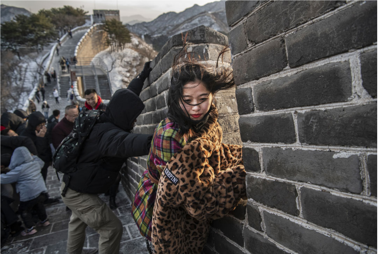
2019年11月30日，北京下雪後的寒冷一天，一名中國遊客在大風中艱難地爬上八達嶺長城的路段。