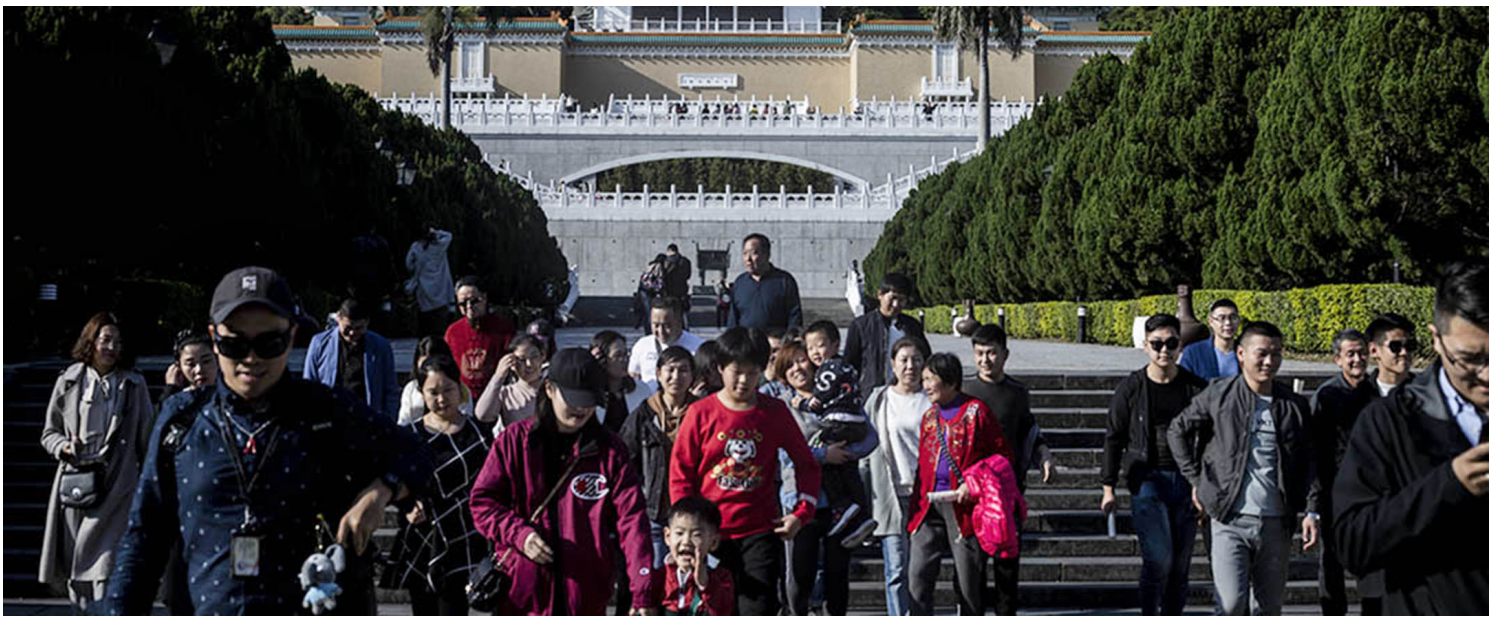
2019年1月28日，台北，遊客在國立故宮博物院遊覽。