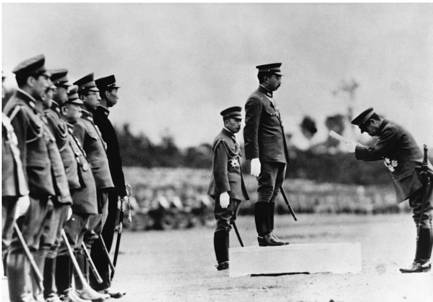
二战期间，日本裕仁天皇在部队检阅期间接受了部队领导人的鞠躬。

日本在二战后经历了民主化改革，昭和天皇发表了“凡人宣言”，从此走下神坛，仅具象征性的元首地位，严禁实质参与政治。而当时与战前天皇制一起落幕的，还有被称为“宫家”的皇族们。除了属于昭和天皇直系三宫家之外，旁系的十一宫家共五十一人，一夕失去了皇族地位。虽然有支付一定的补助金，但皇族因缺乏社会经验与专业技能，大多只好靠变卖财产维生，就此淹没于滚滚红尘之中，至今仅有极少数后裔仍为公众所知。