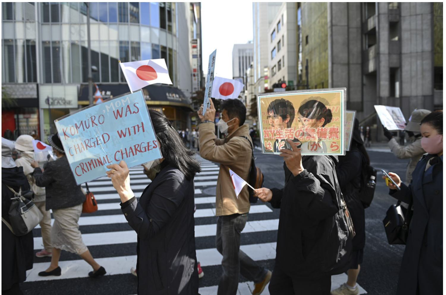
2021年10月26日，日本有人在东京举行示威，反对真子公主与大学同学小室圭结婚。

虽然受到媒体瞩目与放大检视，几乎是各国皇族的宿命，但比起其他公主，真子与小室的婚事之所以如此坎坷，也应是受到近年日本政治环境的影响。对正透过主打修宪、坚持夫妻同姓等“反性平”议题来扩大势力的右翼而言，两人虽然没有明确的政治发言，但可说是以行动肯定了与右翼所谓“日本传统”相对立的“婚姻自由”、“两性平等”与“西方民主”，自然成为投射不满的最佳箭靶。