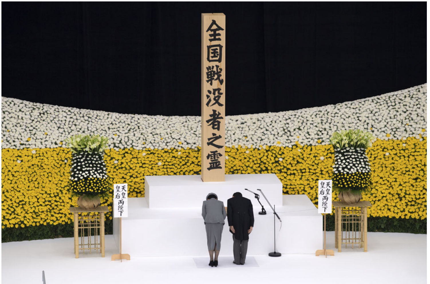
2020年8月15日，日本天皇德仁和皇后雅子在东京的武道馆参加纪念二战日本投降 75 周年的追悼会时鞠躬。

例如在1996年的“新历史教科书”运动中，右翼并未成功令其主导的“新教科书”，实际上普及至教育现场。但有数本相关著作成为畅销书，成功将右翼的历史主张推向舆论市场。而主流的出版社在编纂教科书时，也确实开始顾虑来自右翼的批判，而更加谨慎。就在今年的教科书审定上，各出版社应日本政府要求，再次修改了关于慰安妇的相关内容，也可视为该运动在多年后的成果之一。