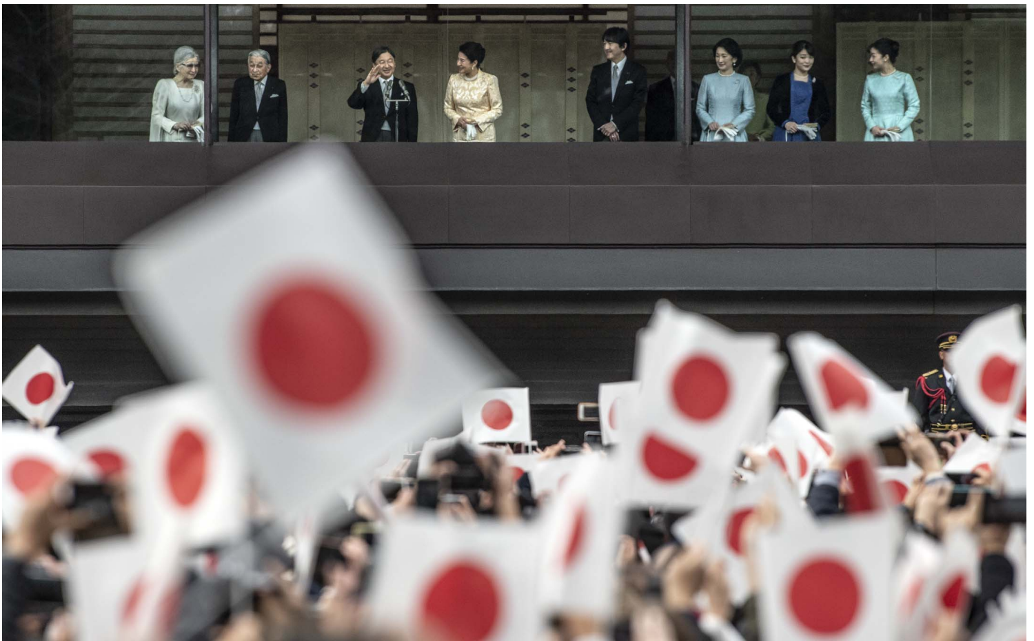
2020年1月2日，日本德仁天皇与皇室人员在东京皇居致以传统新年问候后，祝福者挥舞旗帜。

日本主流民意其实是支持修改为不须强制同姓的，在前述2017年的内阁府调查中，支持修法的比例为42.5%，反对则为29.3%。而在刚落幕的众议院大选中，除了自民党之外，其他八个主要政党，包括执政联盟的公明党，都支持不须强制同姓。